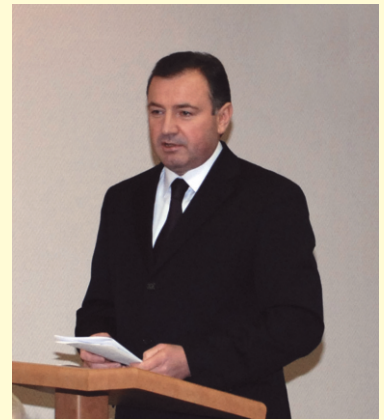
Глава администрации Советского района г.Минска И.В.Стома

Очередной единый день информирования в БНТУ был посвящен важнейшим вопросам будущего нашей республики, а значит и каждого из нас – работников ведущего технического вуза Беларуси. Обсуждалась Программа социально-экономического развития страны на 2011-2015 годы. Во всех структурных подразделениях университета прошли собрания коллективов, на которых слушатели были проинформированы о главных задачах в сферах образования, здравоохранения, предпринимательства, промышленности, денежно-кредитной политики, топливно-энергетическом комплексе и других областях народного хозяйства.