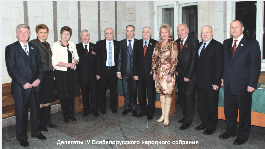
Делегаты IV Всебелорусского народного собрания