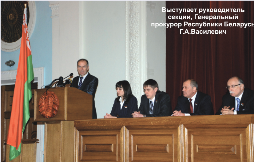
Выступает руководитель секции, Генеральный прокурор Республики Беларусь Г.А.Василевич

ель карьерного роста. И лучшее вложение – это инвестиции в образование. Не случайно наша страна по числу студентов занимает одно из первых мест среди стран