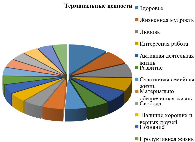
Рис. 1. Иерархия терминальных ценностей студентов технического университета

Счастливая семейная жизнь в иерархии терминальных ценностей оказалась на седьмом месте (5,8 %). Наиболее низкие значения получили ценности общественного признания (4,1 %), счастья других (3,9 %) и творчества (3,8 %). Иными словами, мы можем говорить о том, что юноши и девушки недостаточно заинтересованы в создании семьи и построении счастливой семейной жизни, что, безусловно, может негативно влиять на демографическую ситуацию в стране в ближайшей перспективе.