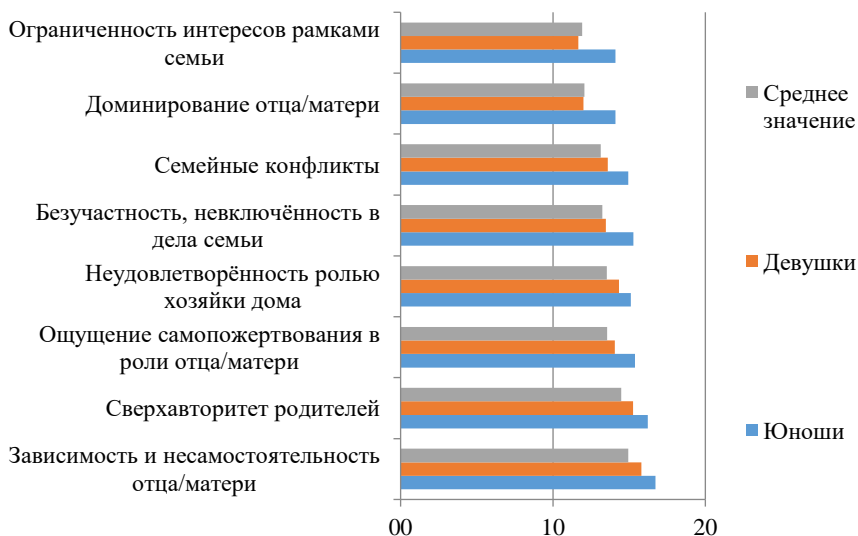
Рис. 3. Анализ результатов диагностики родительских установок студентов

Изучение родительских установок студентов показало, что самым выраженным признаком в шкале «Отношение к семейной роли» является «Зависимость и несамостоятельность матери» (14,9) и наименее выраженным – «Ограниченность интересов рамками семьи» (11,9), что в перспективе может приводить к плохой интегрированности семьи. Наглядно результаты диагностики представлены на рис. 3.