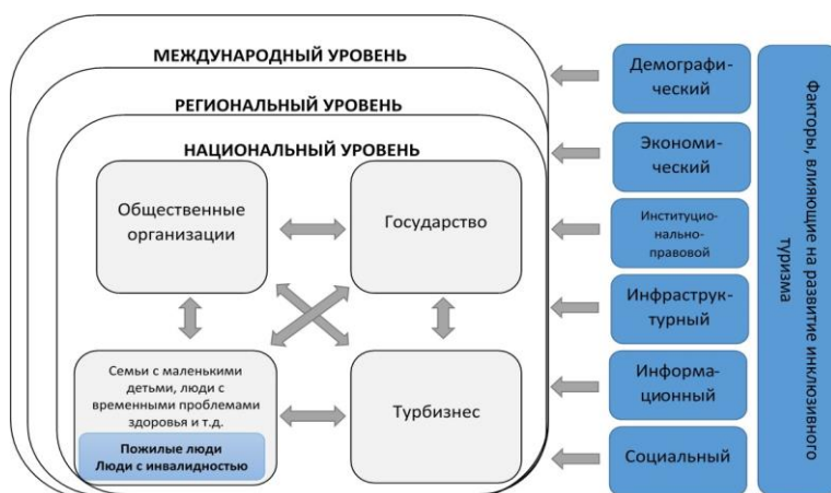
Рисунок 2 – Модель функционирования международного рынка инклюзивного туризма

Автором разработана комплексная модель функционирования международного рынка инклюзивного туризма (рисунок 2), объединяющая ключевых игроков – потребителей, общественные организации, государственные институты и представителей туристического бизнеса. Обозначенные игроки взаимодействуют между собой и оказывают влияние на процесс развития инклюзивного туризма на национальном уровне, они также находятся под воздействием региональных (например, в случае ЕС) и международных игроков в лице международных организаций. На всех уровнях развитие инклюзивного туризма находится под воздействием обозначенных выше факторов.