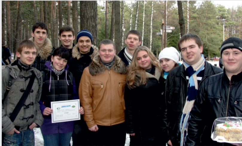
Команда победитель вместе с организаторами.

Также командам предложили бонусный уровень, на котором необходимо было решить 8 логических задач различной сложности. За правильные ответы начислялись бонусные минуты. Победитель определялся по времени, затраченному на прохождение с учетом всех штрафов и бонусов.