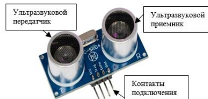
Рисунок 2 – Устройство ультразвукового датчика

– ультразвуковой датчик (рисунок 2). В этих датчиках генерируемые Ультразвуковые волны генерируемые датчиком в последствие отражаются от объектов и фиксируются. Происходит анализ времени прохождения ультразвука и его изменения с целью обнаружения движущихся объектов. Используются в системах безопасности, парковочных системах и промышленности;