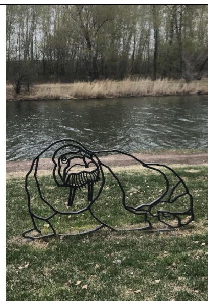
Рисунок 8. Декоративное сооружение «Морж»