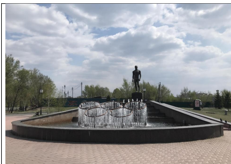
Рисунок 5. Сквер им. И. Ярыгина в Абакане

Третьим примером правильного благоустройства территории была выбрана Набережная Северного дренажного канала в Абакане (рисунок 7). Вдоль набережной находятся плоские декоративные фигуры животных, с которыми люди знакомятся во время прогулки по набережной (рисунки 8-9). Отличительной чертой этой набережной является то, что рисунок фигуры раскрывается только во время приближении к ней. Фонарные столбы тоже повернуты к идущим людям так, чтобы столбы смотрелись плоско. Уличные лавки и урны не имеют острых очертаний, все детали плавные, как у фигур животных.