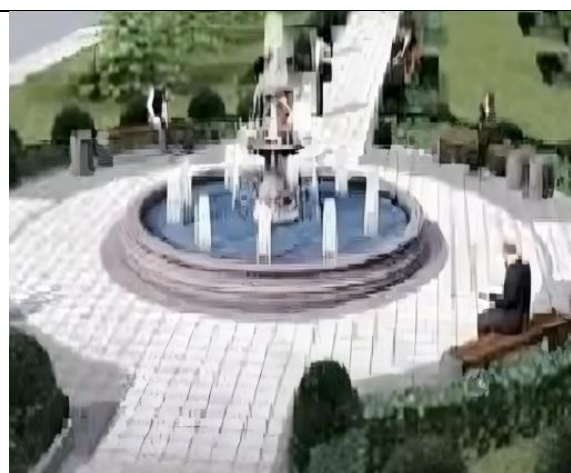
Рисунок 2. Визуализация проекта общественной зоны в Усть-Абакане