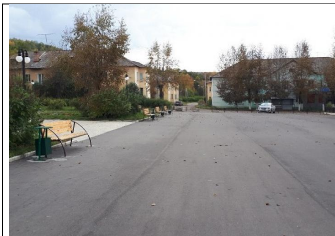
Рисунок 3. Общественная зона в Сорске

На рисунке 4 расположен третий рассматриваемый объект. Здесь положена стандартная тротуарная плитка, как в первом рассматриваемом объекте. Также мы видим всего один уличный диван и одну мусорную урну рядом. Урна и уличный диван очень ярких цветов, которые не сочетаются друг с другом.