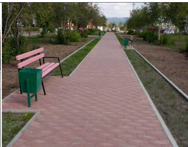
Рисунок 4. Общественная зона в Сорске

Закономерно, что в каждом неудачном примере отсутствует идея и, соответственно отсутствуют детали. Каждый элемент этих зон прост и не несет в себе никакой смысловой нагрузки.