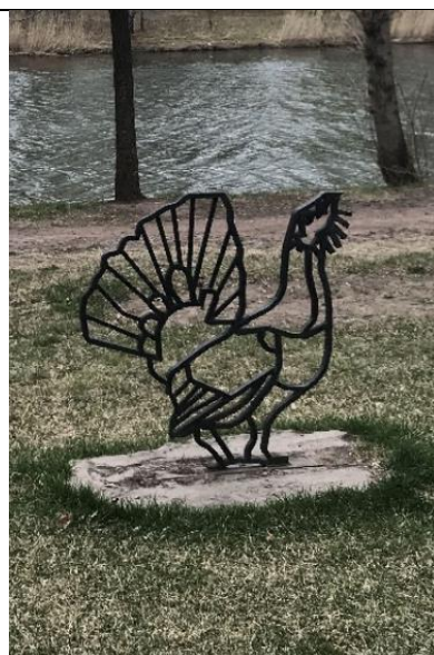
Рисунок 8. Декоративное сооружение «Глухарь»