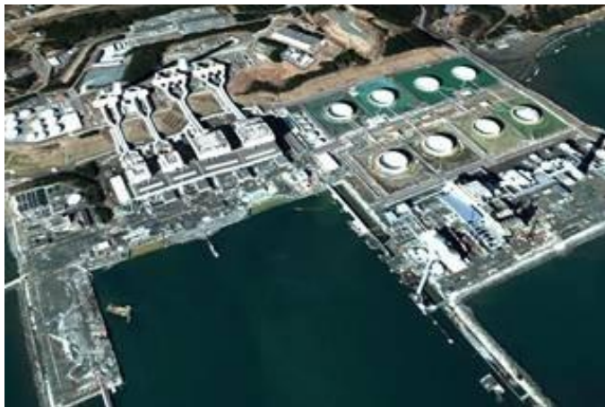
Место расположения: Япония

Атомная электростанция нового поколения, включает в себя пять реакторов BWR, и два – ABWR, которые на данный момент не используются нигде более. Максимальная мощность станции составляет 7 965 МВт.