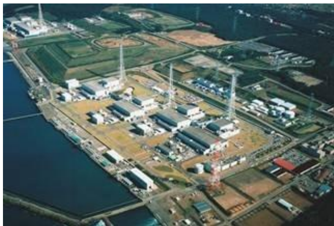
Место расположения: Япония, Фукусима

Так как Фукусима I и II располагаются всего в 11 км друг от друга, их можно считать одной АЭС. Обе электростанции сильно пострадали от землетрясения и цунами, 4 реактора из 6 имеют сильные повреждения. Но до катастрофы это была самая мощная АЭС в мире, максимальная выходная мощность которой составляла 8 814 МВт.