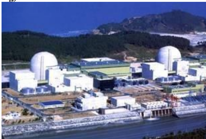
Место расположения: Южная Корея

Первый реактор станции был запущен в эксплуатацию в 1986 году, а на данный момент максимальная мощность, которую может выдавать станция, составляет 5 875 МВт.