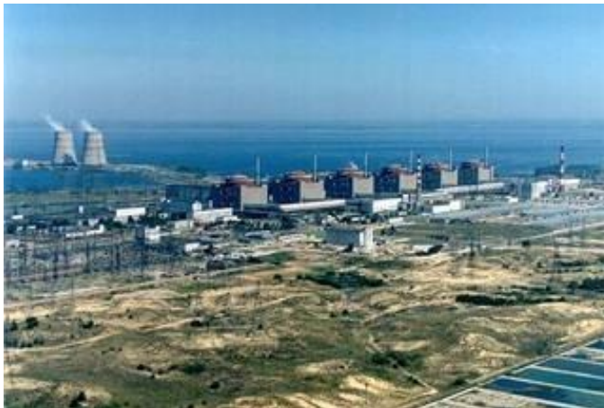
Место расположения: Украина, Запорожье