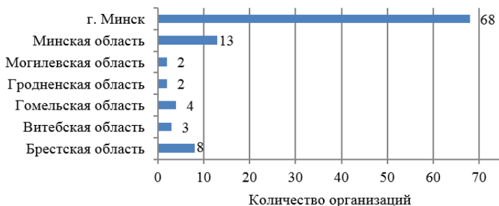
Рисунок 1 – Региональное расположение лизинговых организаций

На начало 2023 года в реестр лизинговых организаций Национального банка Беларуси было включено более 100 организаций, почти 2/3 которых располагаются в г. Минске (рис. 1).