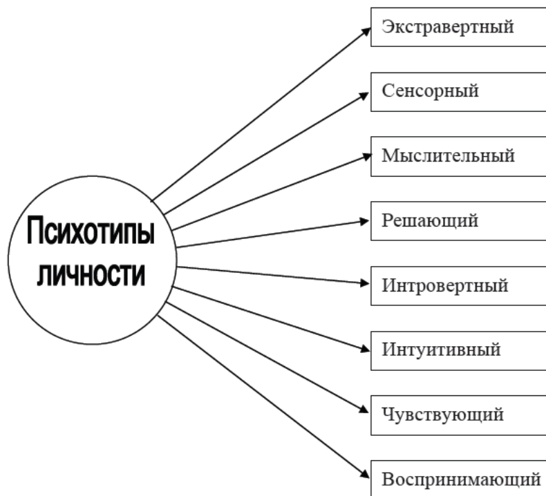
Рисунок 1 – Психотипы личности

В зависимости от направленности психической энергии индивидов можно разделить на следующие психотипы личности (рис. 1).