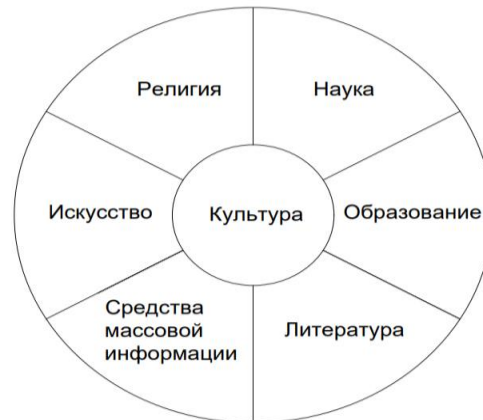
Рисунок 3. Культура в различных сферах жизни

Социология культуры – область социологии, изучающая социальные аспекты создания, хранения, распространения и потребления культурных ценностей. Социологический подход к культуре рассматривает ее как фактор организации общественной жизни, как совокупность идей, принципов, социальных институтов, обеспечивающих коллективную деятельность людей (рис. 3).