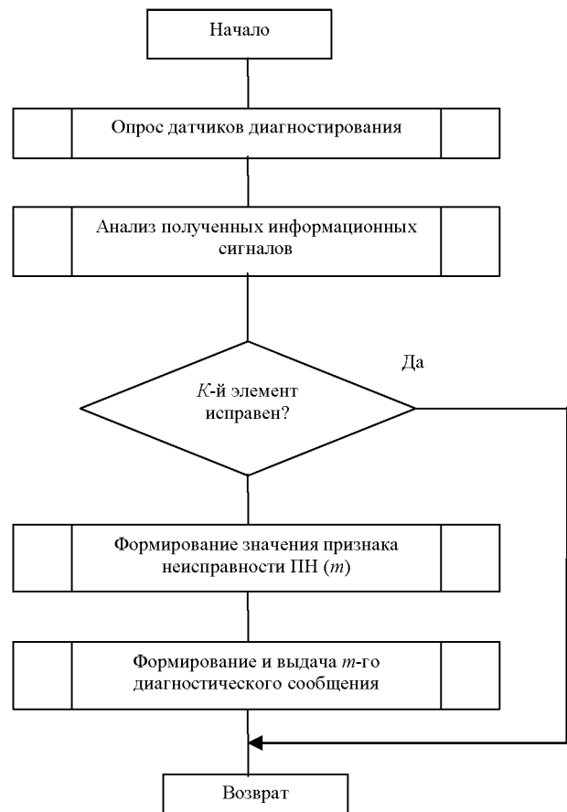
Рис. 3. Укрупненная блок-схема алгоритма бортового диагностирования технических средств и объекта диагностирования

В процессе определения технического состояния микропроцессорная система реализует некоторый алгоритм (рис. 3), представляющий собой опрос датчиков диагностирования и сравнение полученных значений информационных сигналов с константами технически исправного объекта диагностирования, внесенными в память микроЭВМ, а также правил последовательности выполнения и анализа этих проверок. Если в результате обработки этой информации K -й элемент оказывается исправным, то признаку неисправности ПН ( m ) присваивается необходимое значение и формируется соответствующее диагностическое сообщение [1].