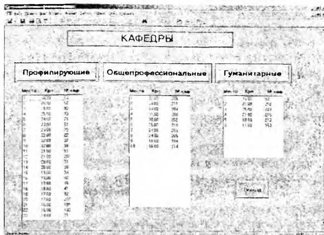
Рис. 2. Вид окна с данными расчета коэффициентов реализации научно-педагогического потенциала кафедр.

Несмотря на то, что полное исключение влияния человеческого фактора оказалось практически невозможным, предложенный подход позволил свести его влияние к минимуму, обеспечивая тем самым повышение объек-