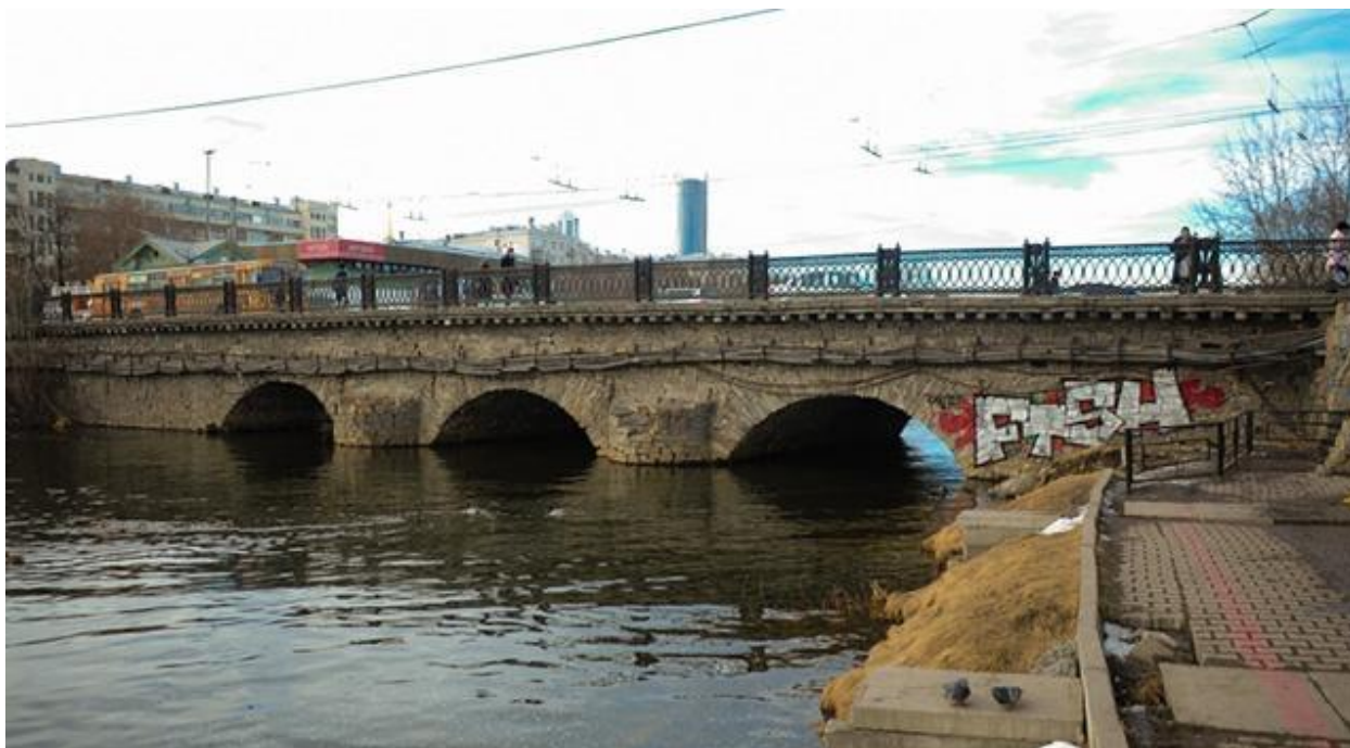
Рисунок 1 – Мост по улице Малышева в Екатеринбурге

В ходе проверки представителями областного министерства по управлению госимуществом моста, располагающегося по улице Малышева в Екатеринбурге (Рис. 1), было выявлено, что данное сооружение находится на грани разрушения.