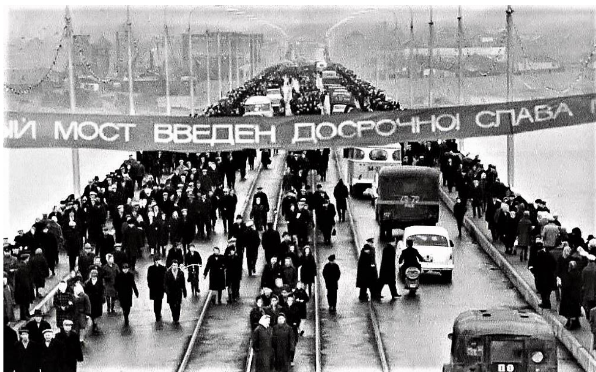
Рисунок 2 – Торжественное открытие моста

Открытие Коммунального моста случилось 1 ноября 1967 года. Для города это стало весомым событием, с массой праздничных мероприятий, на котором собрался почти весь город (Рис. 2).