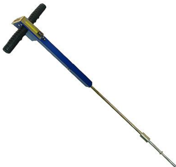
Рисунок 7 – статический плотномер СПГ-М

Возможности современных приборов позволяют быстро и точно определить плотность земляного полотна. Универсальность плотномеров позволяет использовать эти приборы не только для контроля качества при возведении автомобильных дорог, но и укладке трубопроводов, кабелей, при строительстве железных дорог. А их разнообразие предоставляет для инженеров неплохой выбор, подходящий под конкретную задачу.