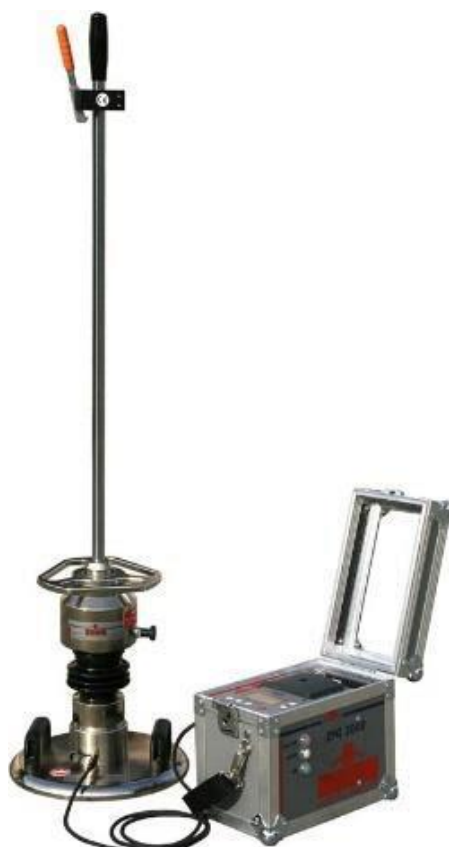
Рисунок 3 – электронный динамический плотномер грунта ZFG 3000