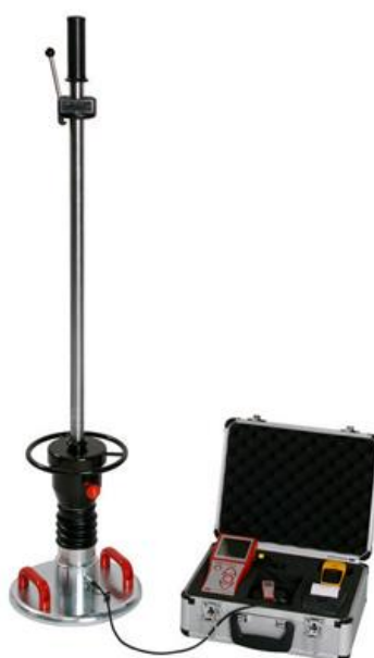
Рисунок 4 – электронный динамический плотномер грунта HMP LFG

Метод статического зондирования основан на приложении статической, вдавливающей нагрузки. Преимуществами данного метода является точное приложение нагрузки (до 0.001 Мпа), а следовательно, и точность проводимых работ.