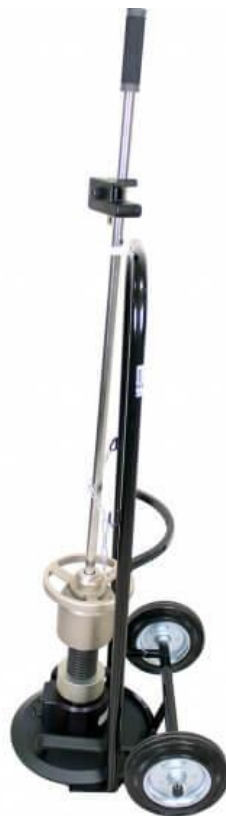
Рисунок 2 – динамический плотномер ДПГ-1.2

Примерами современных динамических плотномеров являются: ДПГ-1.2 (Рис 2), ZFG 3000 (Рис 3), НМР LFG (Рис 4) и другие.