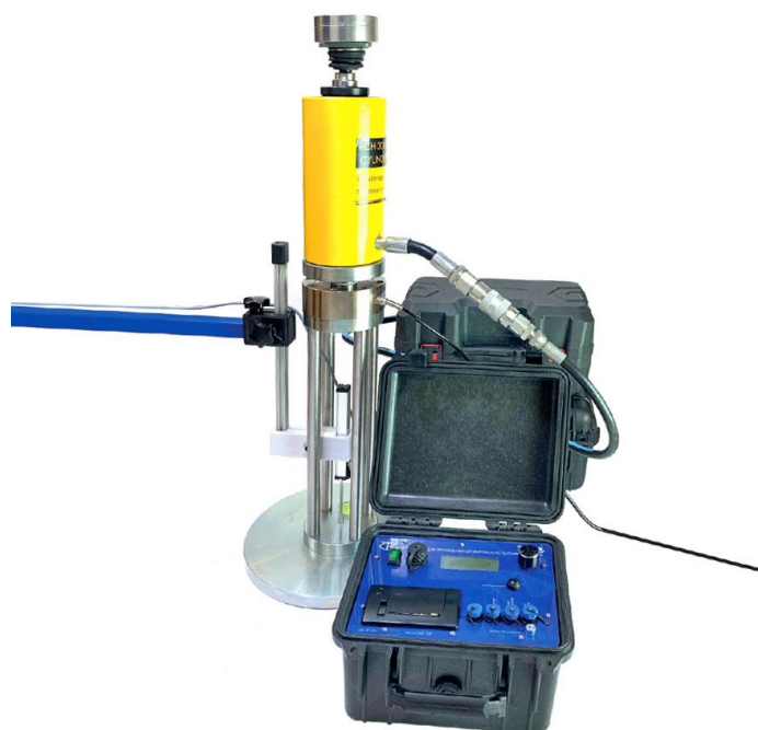
Рисунок 6 – статический плотномер грунтов УПОР-1

Примерами современных статических плотномеров являются: УПОР-1 (Рис 6), СПГ-М (Рис 7) и другие.