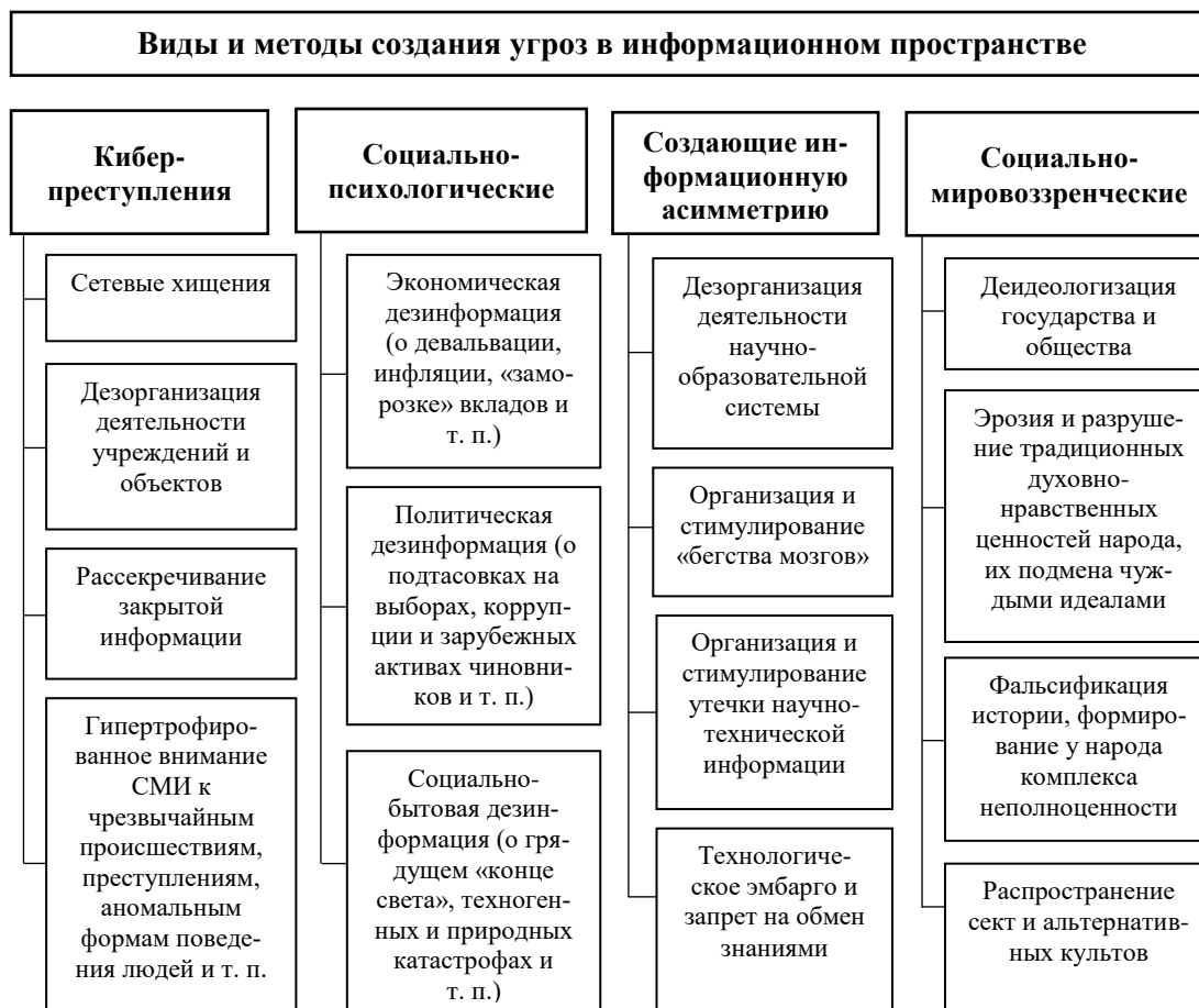
Рисунок 1 – Классификация методов и инструментов создания угроз в информационном пространстве

С учетом данного принципиального замечания нами классифицированы методы и инструменты создания угроз в информационном пространстве (рисунок 1), среди которых, на наш взгляд, необходимо выделить социально-мировоззренческие факторы, влияние которых на социально-экономическую сферу не только недооценивается, но и зачастую вообще игнорируется.