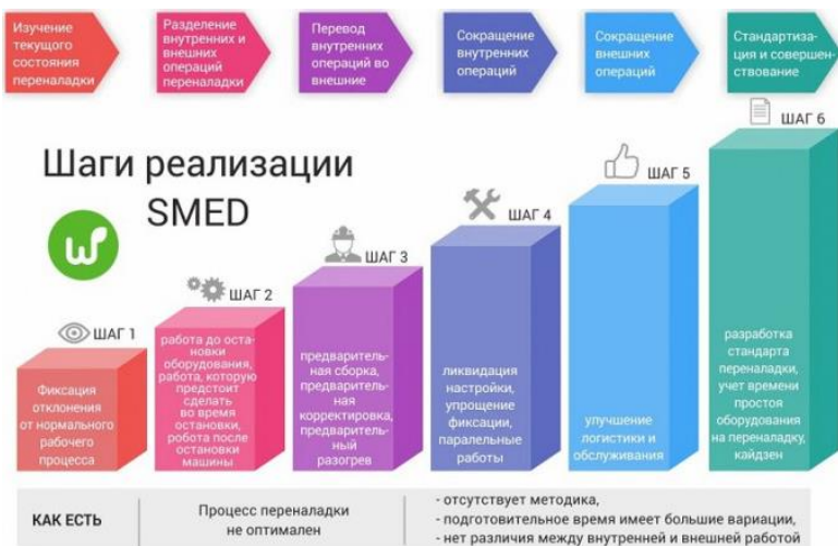
Рисунок 1 – Шаги реализации SMED

По своей сути SMED заключается в разделении процесса переналадки на внутренние и внешние задачи. Внутренние задачи – это те, которые могут выполняться только при остановленном оборудовании, в то время как внешние задачи могут быть выполнены, пока оборудование все еще работает. Преобразуя как можно больше внутренних задач во внешние, SMED стремится оптимизировать процесс переналадки и свести к минимуму время простоя.