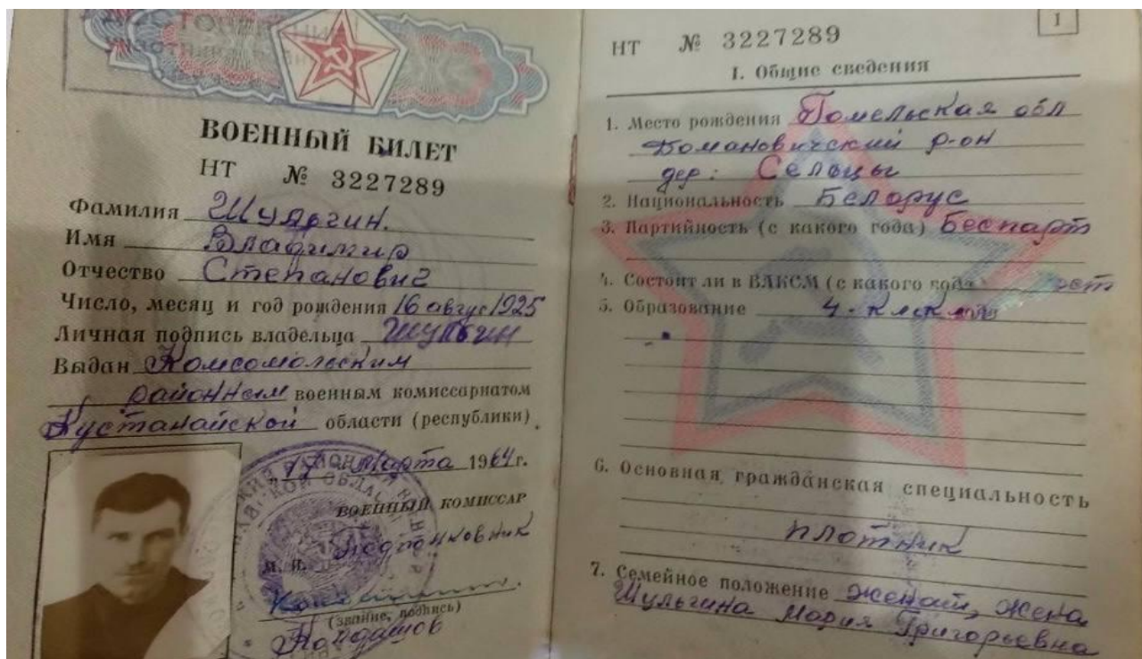
Фото 2. Военный билет Шульгина В. С.

практически сразу стали членами отряда, ведь военное время требует от человека быстрого и стремительного принятия решений: только так можно выжить в экстремальных ситуациях. Война не оставляет тебе выбора и единственный стимул – оставшаяся надежда на мирное небо над головой и тихое счастье в кругу семьи.