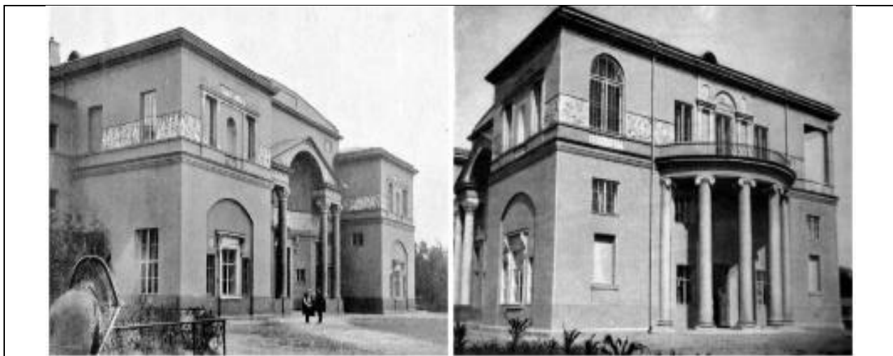
Малюнак 3. Рэалізаваны дом Скакаваго таварыства ў класічным стылі.

Але Жалтоўскі пераконвае замоўцу ўжо ў працэсе цалкам перарабіць будынак у класічным стылі (Мал. 3). Варта адзначыць, што ў той час абсалютнае панаванне належала авангарду, і, адпаведна, такім стылям як мадэрн і арт-дэко, а ўся класіка лічылася састарэлай і ўспрымалася ў якасці перажытку.