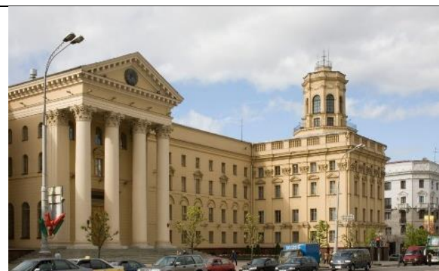
Малюнак 8. Будынак КДБ у Мінску

Яшчэ ў 1944 г. за сваю дзейнасць Жалтоўскі атрымаў званне Заслужанага дзеяча мастацтваў БССР. У 1947 г. ён стаў ганаровым членам Беларускай акадэміі навук. У другой палове 1940-1950-х гг. майстэрня-школа Жалтоўскага нагадвае «асабістую акадэмію» мэтра. Пад ягоным асабістым кіраўніцтвам тут робяцца ўсе конкурсныя работы, што праводзіліся ў Маскве. І вось, у 1950 г. майстар нарэшце атрымлівае Сталінскую прэмію. З гэтага моманту ад папярэдняе крытыкі не застаецца ані знаку.