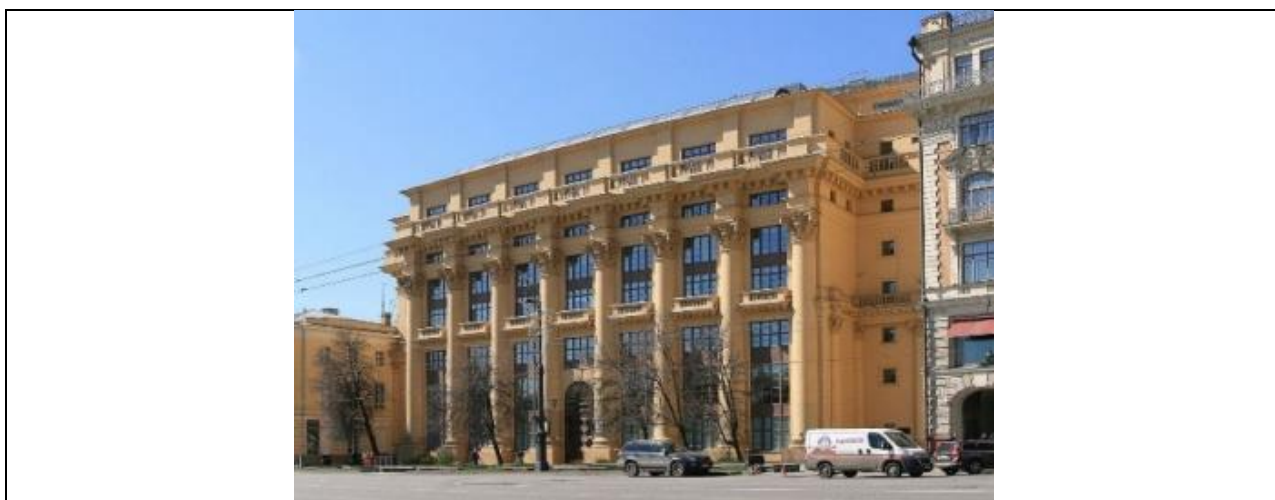
Мал.6. Дом на Махавой у Маскве.

Палац Саветаў так ніколі і не быў пабудаваны, таму першым помнікам новага стылю, створаным Жалтоўскім, можна лічыць пабудаваны ў 1934 г. дом на Махавой, які меў манументальны ордарны фасад, пазычаны ў паладыянскай Лоджыі дэль Капітанія (Мал. 6). Паводле знакамітай цытаты Вясніна дом стаў «цвіком у труну канструктывізму».