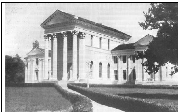
Малюнак 7. Дом Саветаў у Сочы