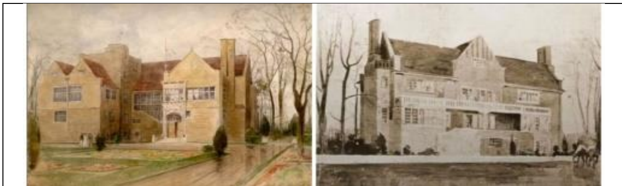
Малюнак 2. Конкурсны праэкт Скакаваго павільёна 1902 г. Варыянты ў модным англійскім стылі

Да прыкладу ў 1903-1906 гг. архітэктар прадстаўляе на выставу конкурсны праэкт дома Скакаваго таварыства ў стылі асабнякоў віктарыянскай эпохі (Мал. 2). Тое можна патлумачыць фактам, што захапленне коньмі расійскай арыстакратыі і прыйшло менавіта што з Англіі.