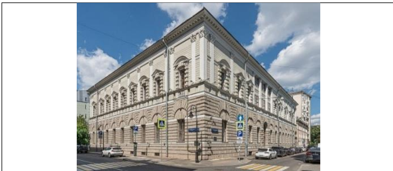
Малюнак 4. Фасады дома Тарасава ў Маскве.

Многія з тых, хто піша пра творчасць Жалтоўскага, намагаюцца абмінуць выпадак з домам Тарасава (1912 г.), які, аднак, адзначыўся спрэчным метадам выкарыстання мастацкай спадчыны мінуўшчыны (Мал. 4). Справа ў тым, што творчы ўнёсак менавіта Жалтоўскага палягаў у дадаванні аднаго-двух шэрагаў каменнае кладкі ў цокальнай частцы фасада. У астатнім будынак паўтараў палац Цьенэ ў Вічэнцы за аўтарствам Паладыа. Падобны выпадак адбыўся і з праектаваннем халадзільніка ў Маскве, аднак сучаснікі архітэктара і абсалютная большасць даследчыкаў, ведаючы гэтыя факты, усё адно нават не ставілі пытання пра аўтарства архітэктурнага вобраза асабняка Тарасава.