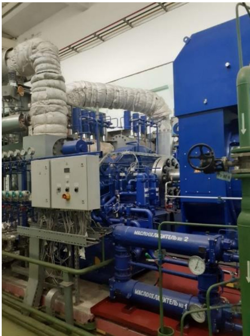
Рисунок 1 – Турбоустановка на Могилевской ТЭЦ-1