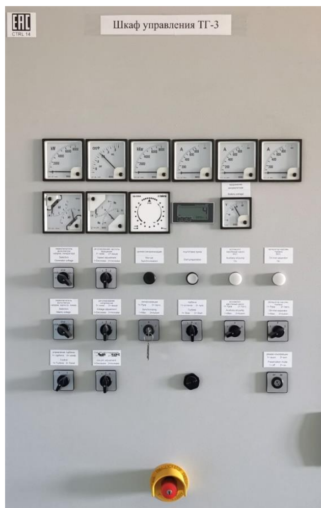
Рисунок 3 – Шкаф управления ТГ-3

Дренажные системы турбины предназначены для удаления из турбины и паропроводов конденсата в результате работы турбины. Дренажная система включает в себя дренажи ЦВД, ЦНД, дренажи паропровода острого пара (от главного паропровода до стопорного клапана), дренажи выхлопного паропровода.