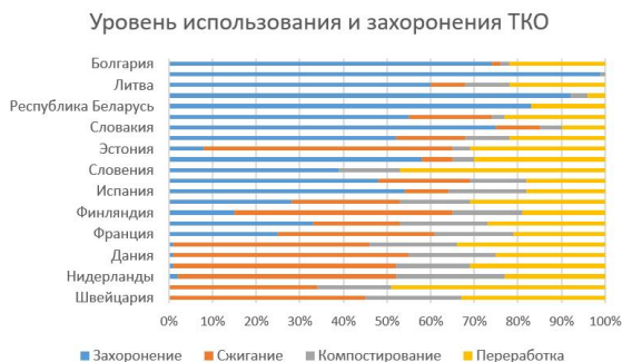
Рисунок 1 – Уровень использования и захоронения ТКО

В исследовании ООО «ЭкоРисайклинг» объем образования твердых коммунальных отходов (ТКО) в Республике Беларусь составляет от 3 до 3,65 миллионов тонн в год (рисунок 1). Ресурсные мощности действующих полигонов исчерпывают себя. Возникает острая необходимость в уменьшении объемов отходов и приближении к их экологичной утилизации [2].