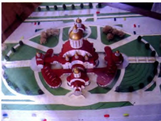
Мал. 6. Комплекс прыхода ў гонар Раства Хрыстова ў Салігорску