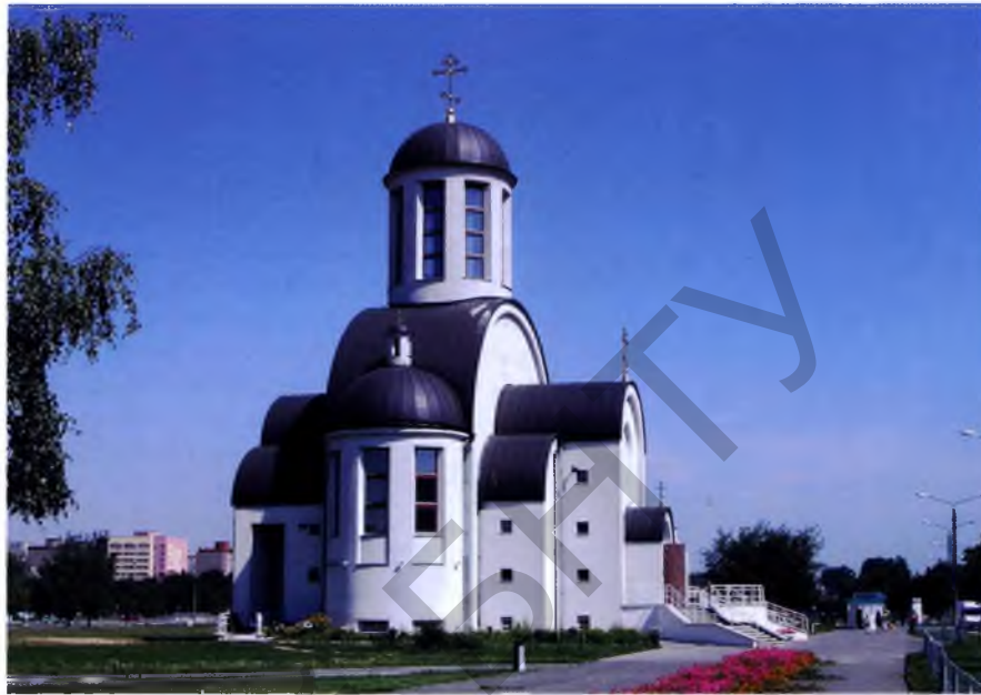
Мал. 7. Свята-Траства-Багародзіцкая царква ў Салігорску

– сакральны складнік . Нягледзячы на свецкі характар беларускай дзяржавы, лагічным выгля-