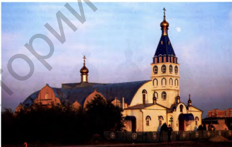
Мал. 3. Храм у гонар абраза Божай Маці «Ціхвінскі» ў Брэсце

цыі як прафесійнымі архітэктарамі і будаўнікамі, так і ўласнымі сіламі прыходаў.