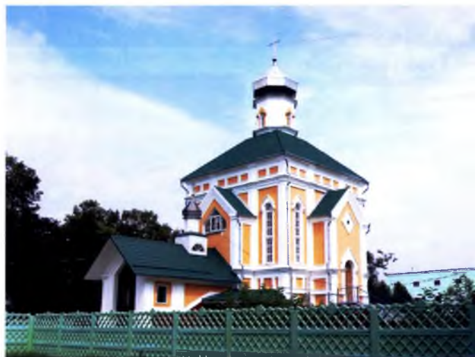
Мал. 4. Свята-Міхайлаўская царква ў п. Касцюкоўка, Гомельскі р-н

Метад стылізацыі ў пэўнай ступені з'яўляецца кампрамісам, дзе архітэктура папярэдніх перыядаў атрымлівае сучаснае гучанне дзякуючы новым сродкам архітэктурна-мастацкай выразнасці (мал. 4). Вобразнае ўвасабленне знаходзяць эстэтычныя прыярытэты, характэрныя для дадзенага часу, што надае актуальнасць сучаснаму храмабудаўніцтву, захоўваючы шчыльную знітанасць з традыцыямі храмабудавання. Адноўныя якасці метаду – абмежаванасць архітэктурных першаўзораў, якія прымаюцца за аснову; элемент «умоўнасці і гульні», на якім будуюцца стылізагарства. На горадабудаўнічым узроўні метада стылізацыі можа дастаткова гарманічна спа-