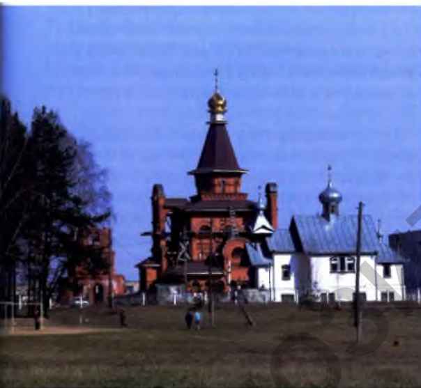
Мал. 1. Свята-Троіцкая царква ў п. Бараўляны, Мінскі р-н