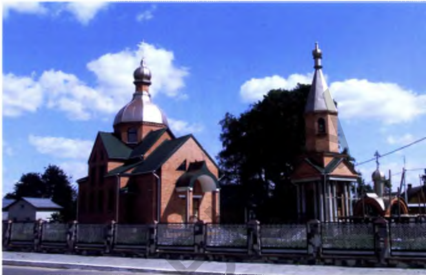
Мал. 2. Свята-Мікалаеўская царква ў аграгарадку Лучнікі, Слуцкі р-н

перыядаў, у якой будуць спалучацца якасці суседніх стыляў. Пры дапамозе названага прыёму можна максімальна арганічна злучыць рознахарктарную тканіну паселішча. На функцыянальна-планіровачным узроўні эклектыка раскрывае больш шырокі ў параўнанні з метадам імітацыі спектр рашэнняў, якія ў большай ступені адпавядаюць патрабаванням сучаснага прыходскага жыцця, але, нягледзячы на гэта, застаецца праблема «ўпісвання» функцый у вызначаныя старадаўняй архітэктурай планіровачныя схемы. Вобразна-стылістычны ўзровень характарызуецца замкнёнасцю на архітэктурна-мастацкіх падыходах мінулага, не дае кultaвай архітэктуры магчымасці паўнаважна развівацца, хача і прапануе пэўную варыятыўнасць рашэнняў. У адрозненне ад імітацыі метада эклектыкі атрымаў максімальнае распаўсюджанне ў беларускай прыходскай архітэктуры дзякуючы сваёй эстэтычнай непатрабавальнасці, магчымасці рэаліза-