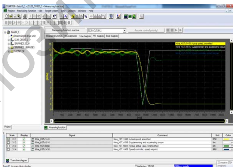
Рисунок 3. Применение функции Measuring.

В программе STARTER имеется функция, называемая как «Measuring function», что в переводе означает измерительная функция.