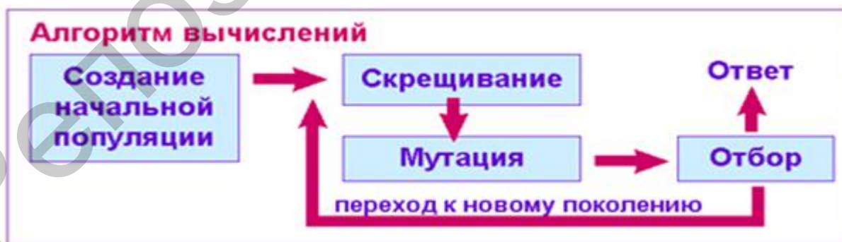
Рисунок 1. Схема генетического алгоритма.

На рисунке 1 представлена схема осуществления генетического алгоритма.