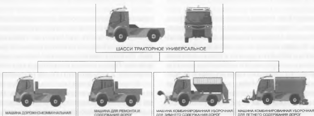
Рисунок 6 — Семейство дорожно-коммунальных машин

национальным техническим университетом, Белорусским государственным технологическим университетом предстоит разработать и освоить производство мобильной трелевочной канатной машины для заготовки древесины из труднодоступных мест, рубильной машины с приводом от автономного двигателя мощностью 280—300 л.с., производительностью не менее 100 насыпных м 3 щепы в час, а также выполнить широкий спектр исследовательских и конструкторских работ по разработке, изготовлению и испытаниям опытного образца перспективного гусеничного трактора общего назначения тягового класса 5,0 с электромеханической трансмиссией.