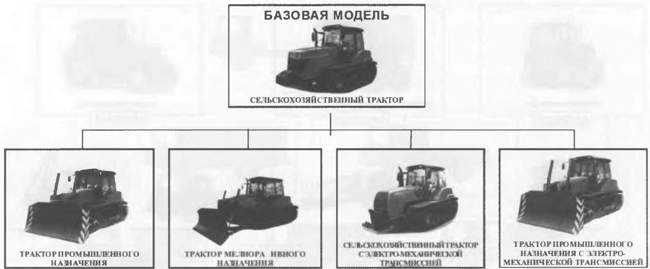
Рисунок 4 — Семейство гусеничных тракторов

Дальнейшее развитие этого направления получило при создании семейства дорожно-коммунальных машин улучшенного дизайна (рисунок 6).