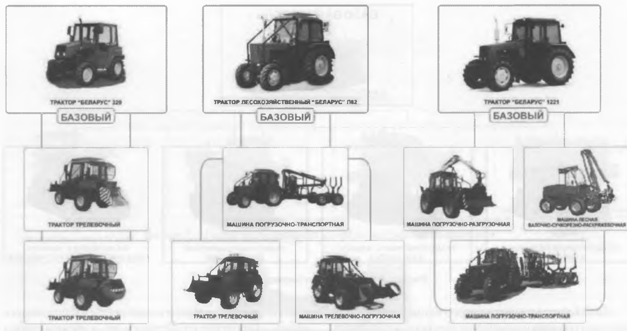
Рисунок 2 — Семейство лесных машин на базе тракторов «БЕЛАРУС»

создания на ПО «МТЗ» специальных машин для коммунального, сельского и лесного хозяйств, а также для отраслей строительной, дорожно-строительной и других, которая позволяет повысить эффективность работы вышеназванных отраслей и улучшить экономическое положение ПО «МТЗ» и ряда промышленных предприятий республики, работающих с ним в кооперации.