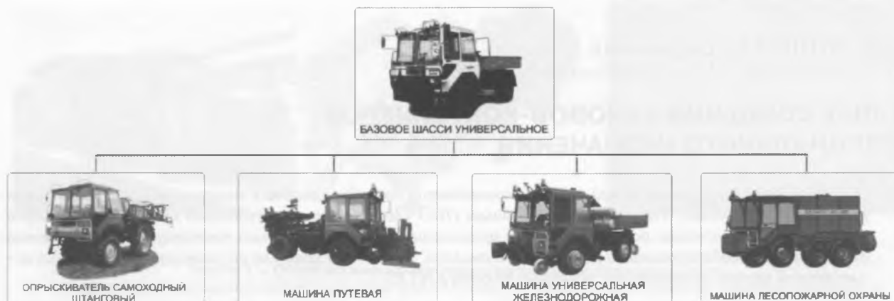
Рисунок 5 — Семейство специальных машин на базе шасси универсального