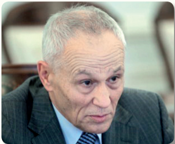
Государственный секретарь Союзного государства Г.А. Рапота