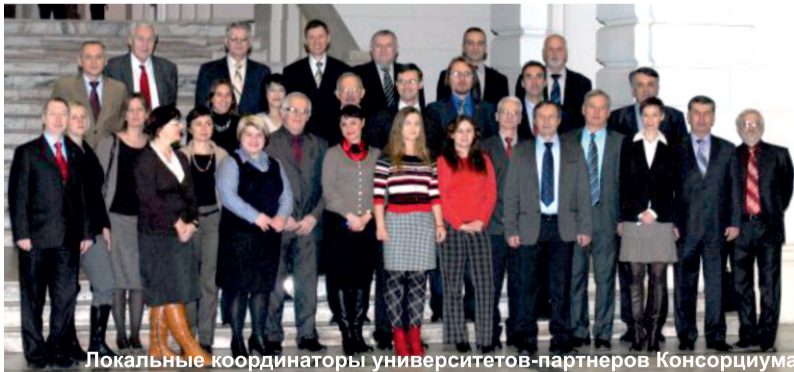
Локальные координаторы университетов-партнеров Консорциума

Участники проекта выступили с презентациями своих университетов для информирования коллег по проекту о направлениях сотрудничества в образовательной и научно-исследовательской сфере. Каждый из партнеров назначил своего локального координатора проекта EWENT, который будет контактным лицом по всем вопросам, связанным с приёмом заявок, отбором кандидатов, курированием и консультированием участников программы. Подробная информация о требованиях к участию в проекте и о предлагаемых учебных программах имеется на сайтах всех университетов-партнеров и на интернет-странице http://ewent.meil.pw.edu.pl/index.php/courses-offered-by-eu-partners . Контактная информация о локальных координаторах университетов приведена на следующей интернет-страничке http://ewent.meil.pw.edu.pl/index.php/local-coordinators .