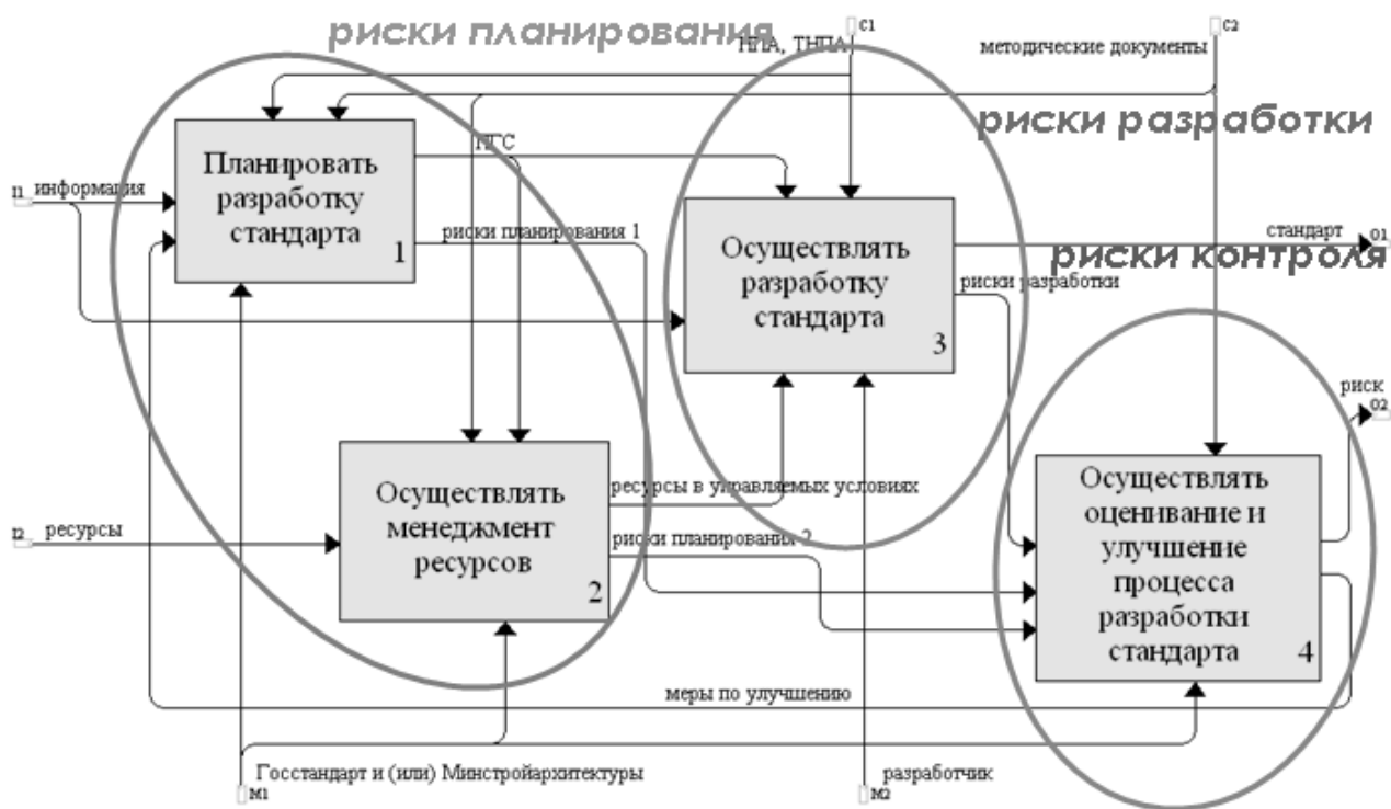
Рисунок 1 – Модель сети процессов разработки государственного стандарта

Существует два принципиально разных механизма изучения потребительского выбора: отношение предпочтения и функция полезности [2]. Отношение предпочтения индивидуально, отражает «склонность» или «желание» потребителя. Термин «полезность» менее индивидуален, чем термин «предпочтение», т.е. более объективен.