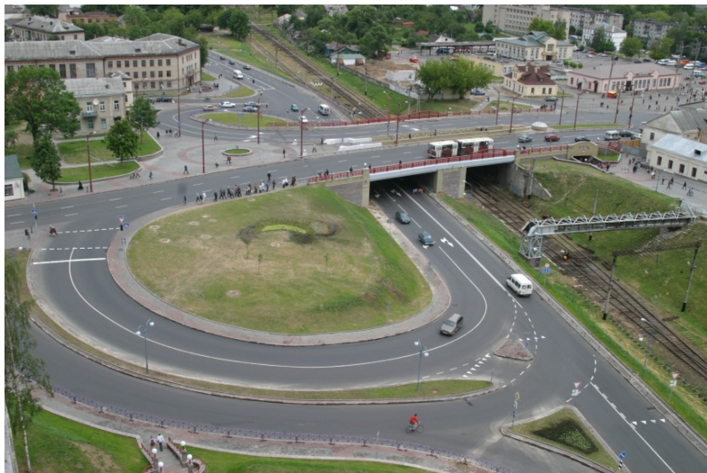
Рисунок 1 – Пример развязки, устроенной в г. Гродно

дорожного движения на них, в результате чего стал возможен выбор оптимального решения (рисунок 1).