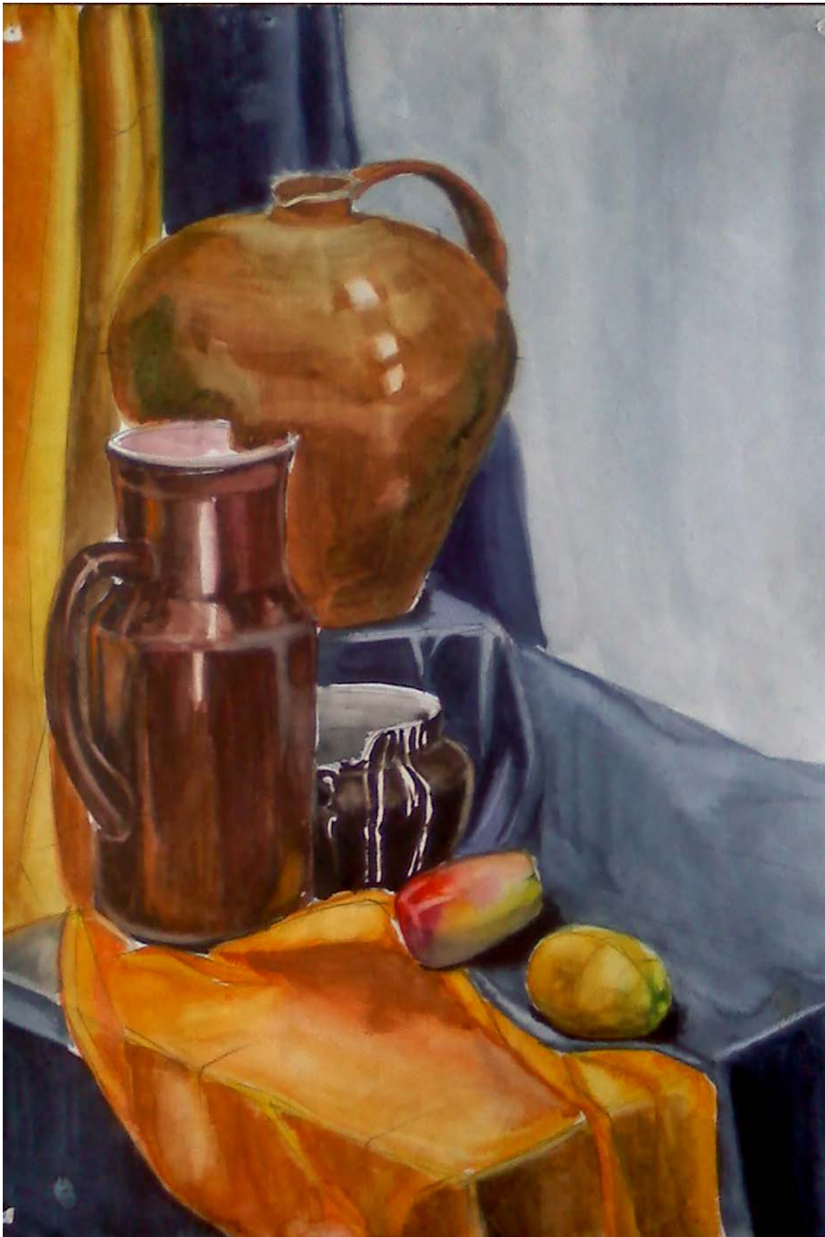
Рис. 7. Натюрморт, состоящий из ярких по цвету предметов и драпировок, расположенных на нескольких уровнях