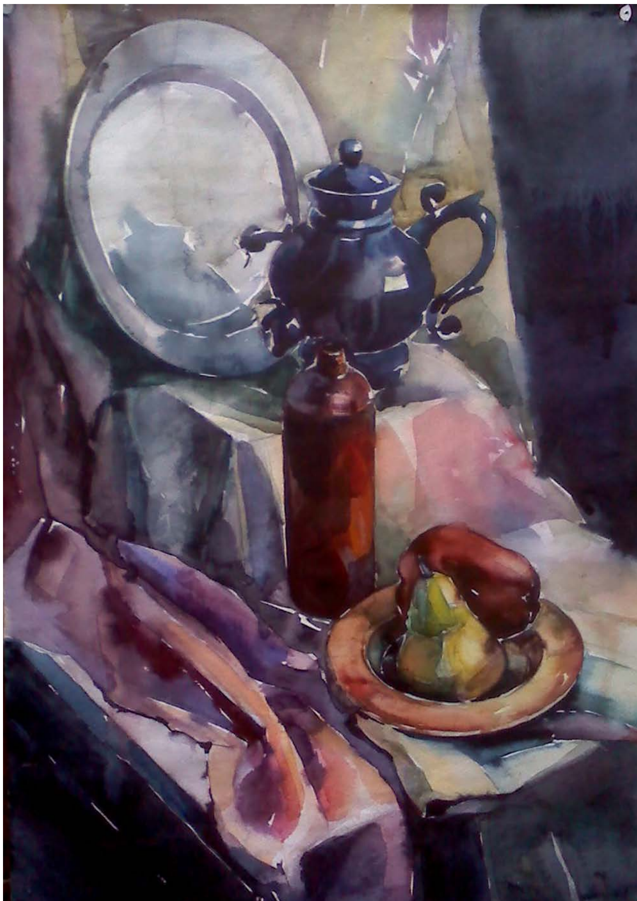
Рис. 9. Натюрморт, состоящий из сдержанных по цвету предметов и драпировок, расположенных на нескольких уровнях