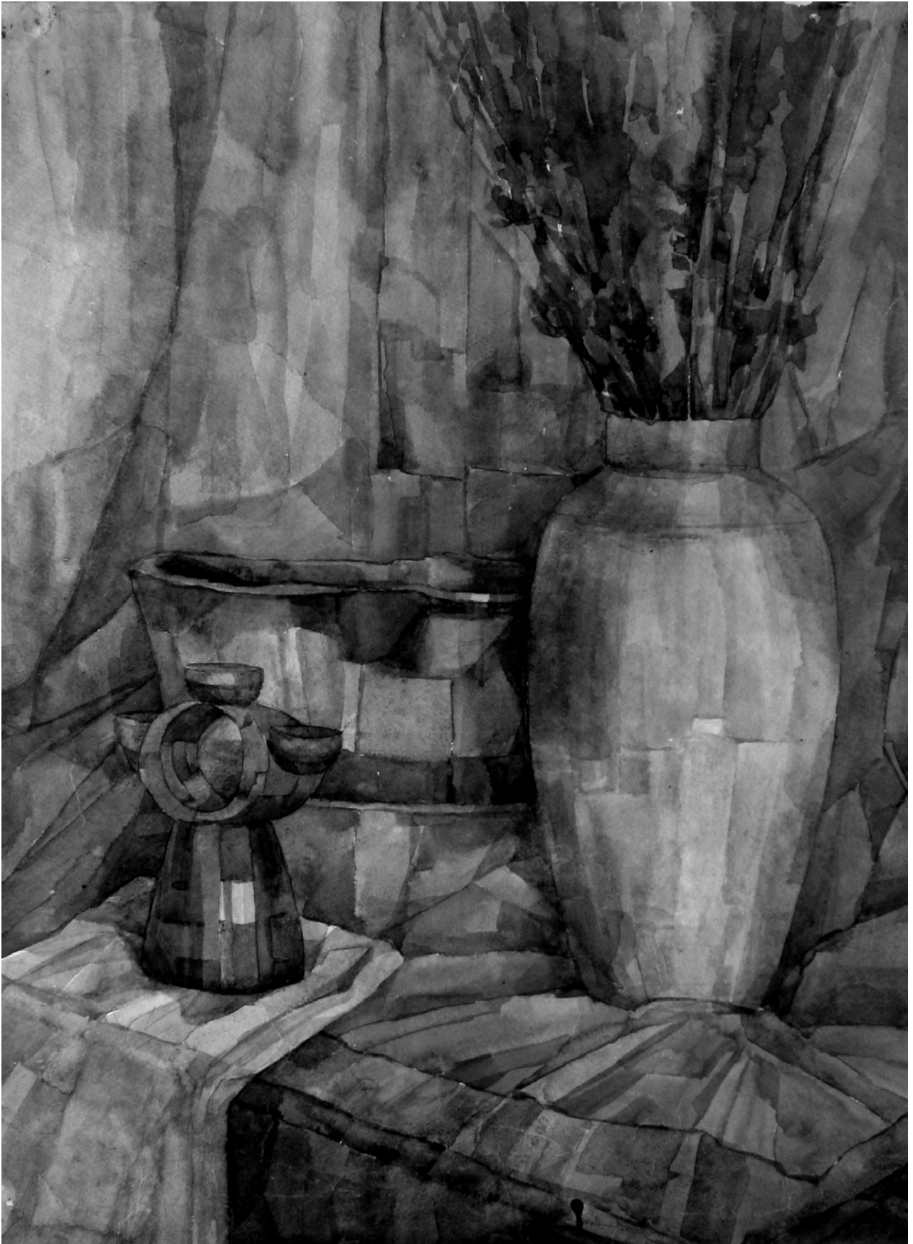
Рис. 1. Натюрморт в технике монохромной гризайли, выполненный одной краской