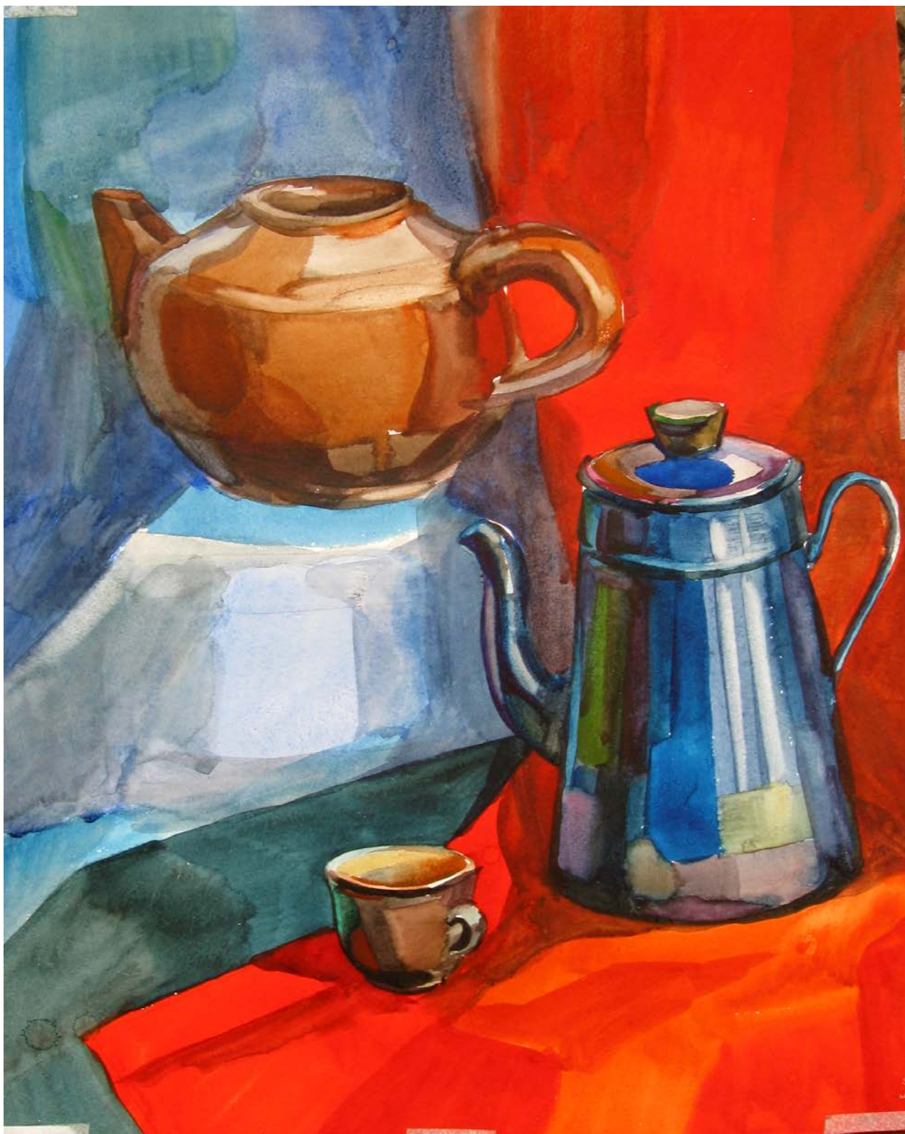
Рис. 4. Натюрморт, состоящий из ярких по цвету предметов и драпировок