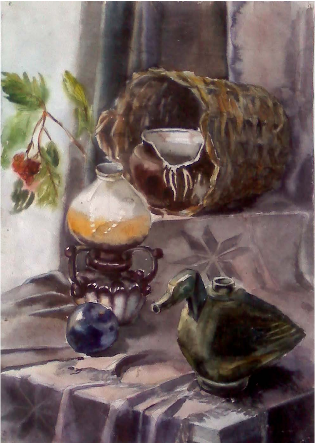
Рис. 10. Натюрморт, состоящий из сдержанных по цвету предметов и драпировок, расположенных на нескольких уровнях