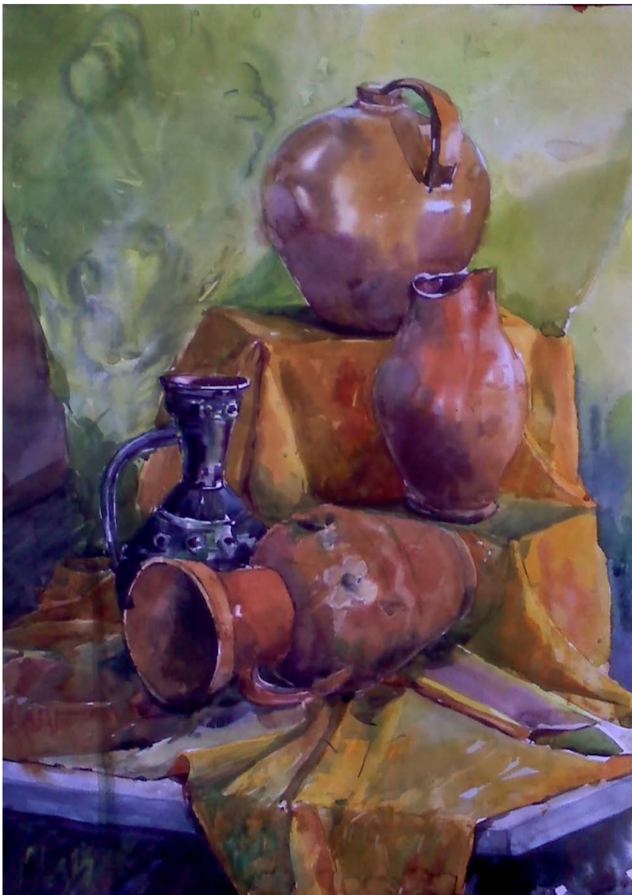
Рис. 11. Натюрморт, состоящий из сдержанных по цвету предметов и драпировок, расположенных на нескольких уровнях