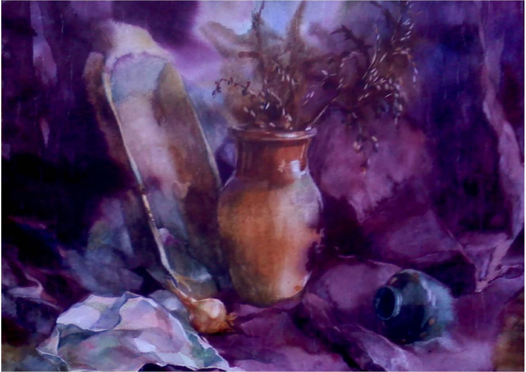
Рис. 6. Натюрморт, состоящий из сдержанных по цвету предметов и драпировок