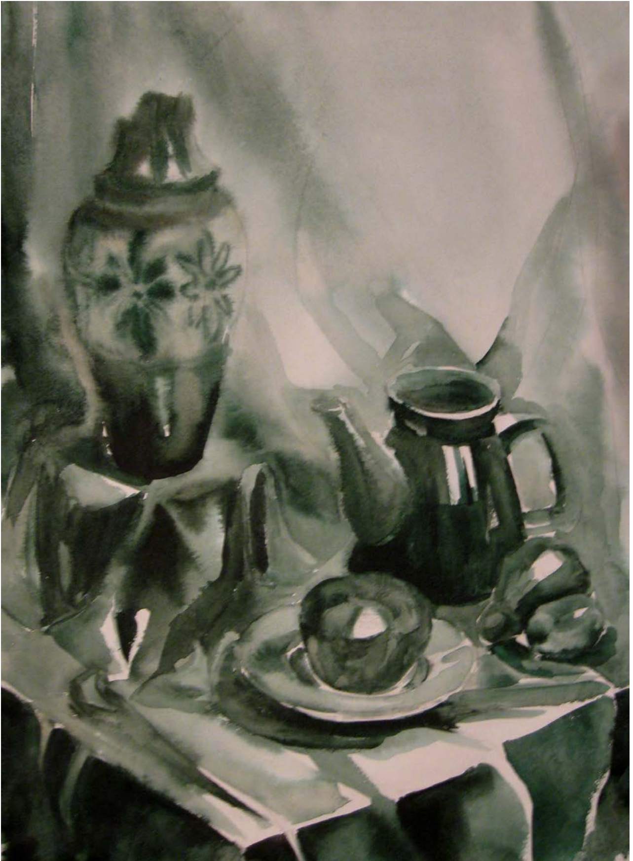
Рис. 2. Натюрморт в технике монохромной гризайли, выполненный одной краской