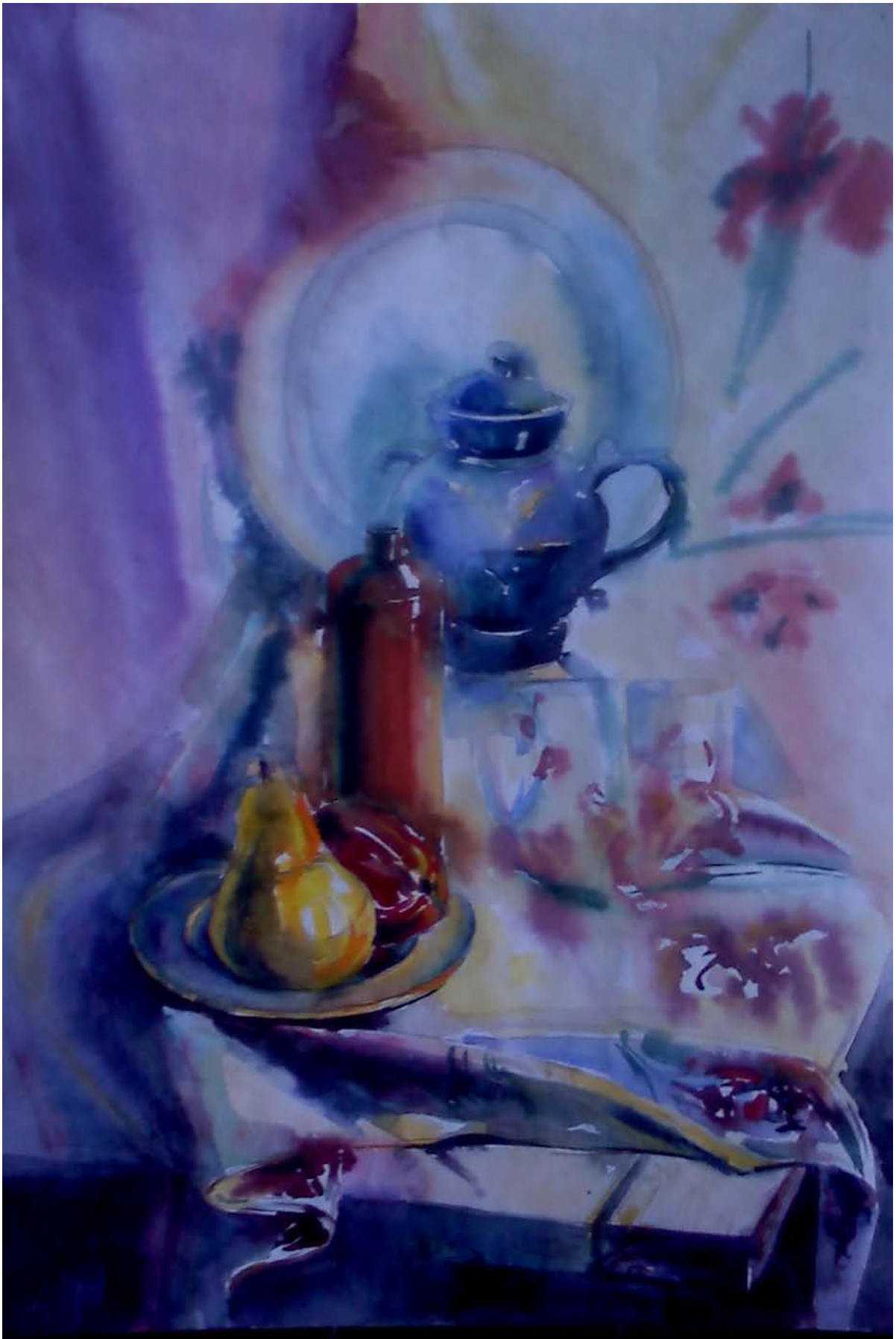
Рис. 12. Натюрморт, состоящий из сдержанных по цвету предметов и драпировок, расположенных на нескольких уровнях