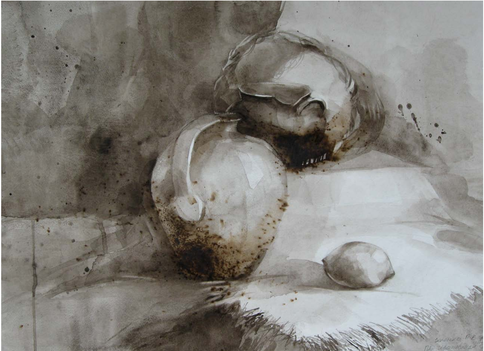
Рис. 3. Натюрморт в технике монохромной гризайли, выполненный двумя красками