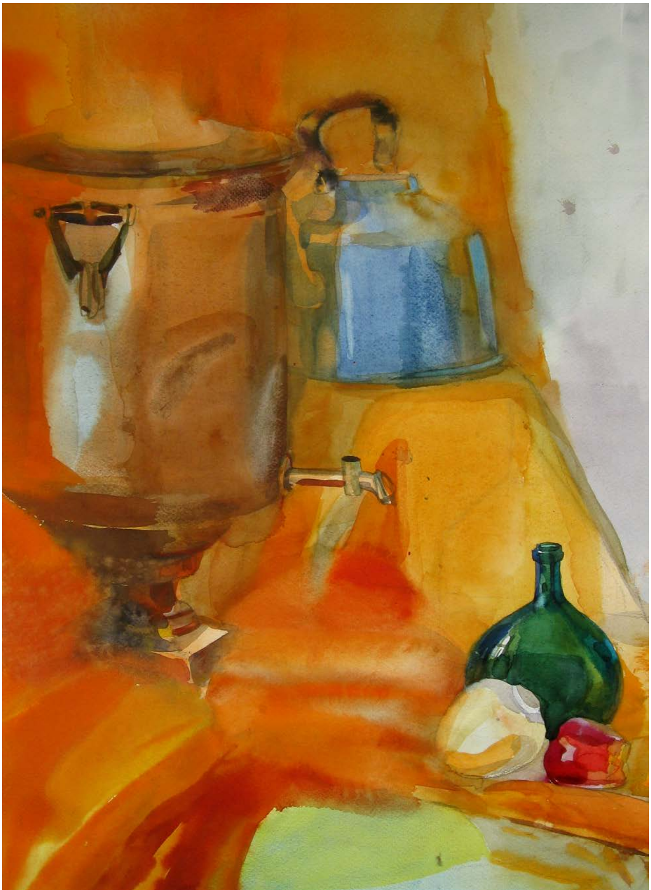
Рис. 8. Натюрморт, состоящий из ярких по цвету предметов и драпировок, расположенных на нескольких уровнях