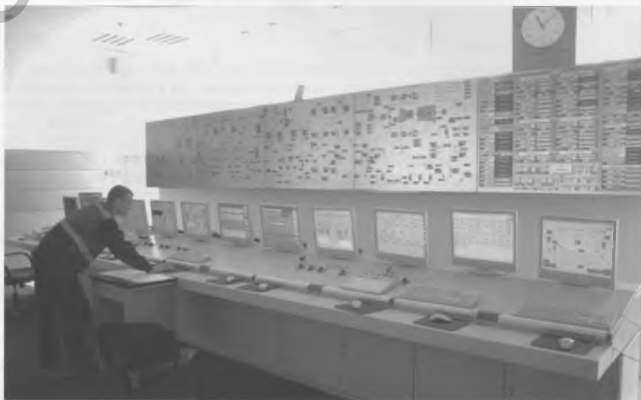
Рис. 2. Вид блочного щита ПГУ Минской ТЭС-3

Для возможности дистанционного управления основным оборудованием установки при полном отказе микропроцессорных средств, а также для представления оператору ПГУ информации о технологических процессах в ней в традиционной форме (мнемосхема, стрелочные и гнездовые приборы) могут устанавливаться панели оперативно-контура управления с ограниченным количеством регистрирующих и показы-