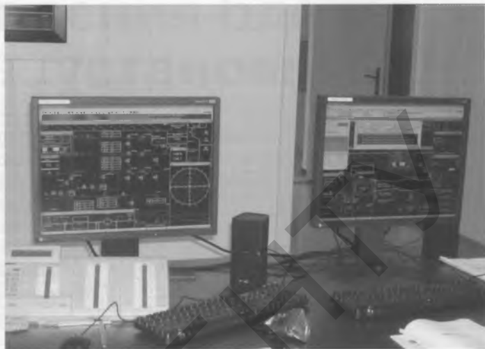
Рис. 4. Пульт управления ПГУ Минской ТЭЦ-5

вающих приборов, табло сигнализации и ключей управления.