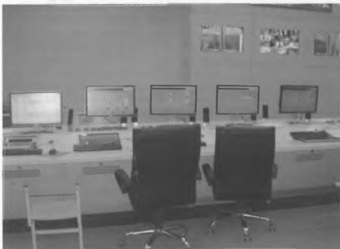
Рис. 3. Блочный щит управления ПГУ Минской ТЭЦ-2