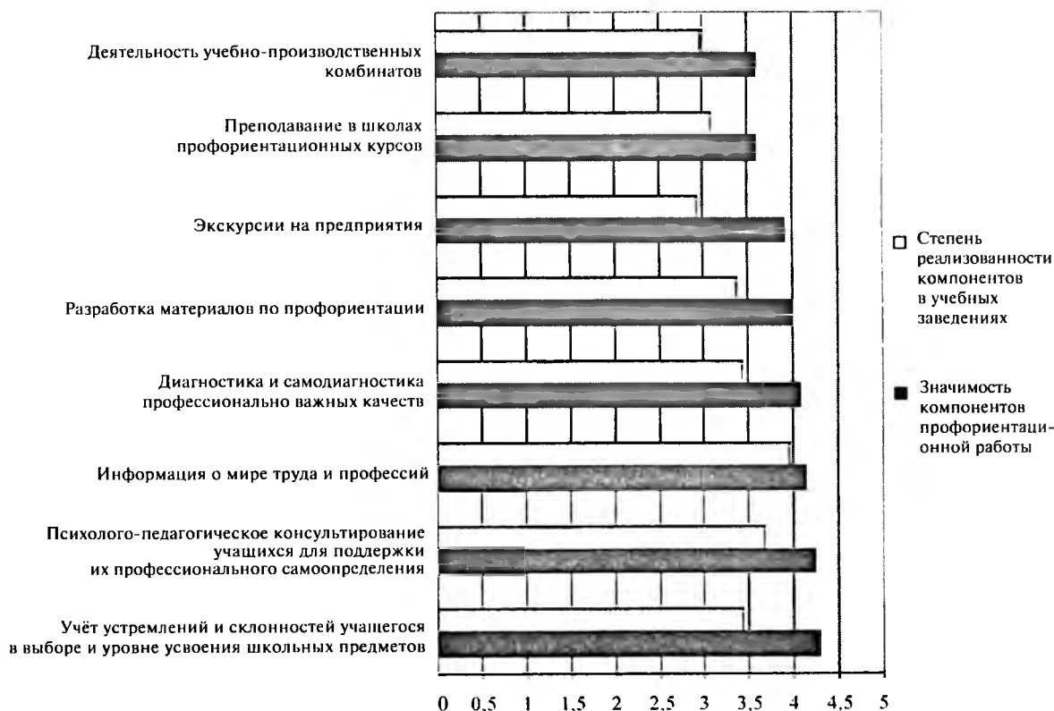
Диаграмма 2 – Значимость и степень реализованности основных компонентов профориентационной работы

Тот факт, что сведения о различных учебных заведениях профессионального образования, правила приёма в них являются самой востребованной информацией, можно объяснить тем, что в последнее время одним из основных факторов, влияющих на выбор абитуриентами учебного заведения и специальности,