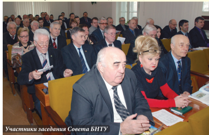
Участники заседания Совета БНТУ

В 2015 г. научная и инновационная деятельность,