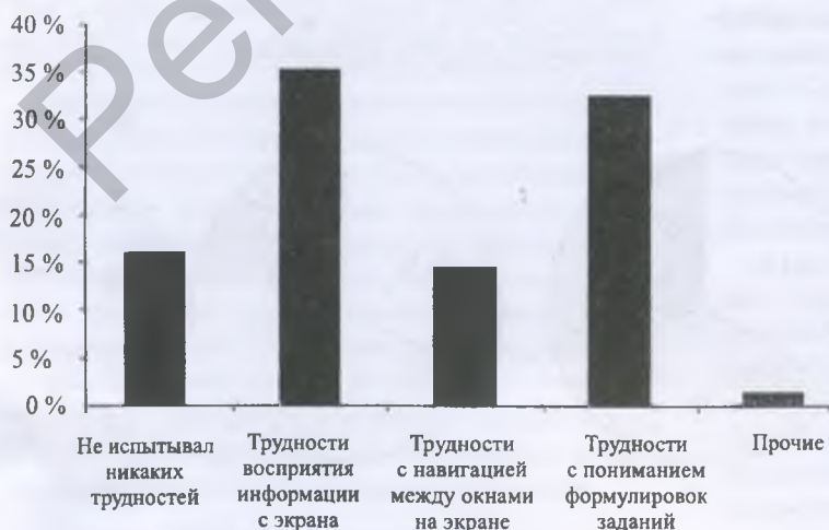
Рис. 2. Основные проблемы, которые испытывают студенты при работе с электронными учебниками

Как видно из рис. 2, основные трудности в начале работы с электронными пособиями у студентов возникают в процессе восприятия информации с экрана (35,3 %), с пониманием формулировок заданий (32,4 %) и навигацией в многооконном режиме (19,1 %). Первые два пункта актуальны для всех дидактических материалов в электронном виде. На небольшом размере экранного пространства особенно важно акцентировать внимание обучаемых на основных моментах предлагаемого материала. На первых этапах работы с электронным учебником преподавателю необходимо проводить постоянный мониторинг за процессом выполнения заданий и, при необходимости, помогать студентам. После освоения инструментария работы с программой, понимая концепцию изложения материала и методику контроля знаний, студенты более интенсивно включаются в процесс самостоятельной работы.