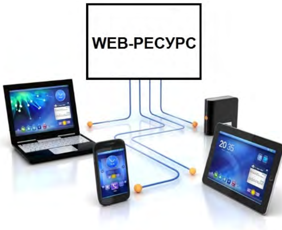
Рисунок 1 - Схема взаимодействия

Актуальность разработки web-ресурс для организации и проведения дистанционного обучения студентов вуза