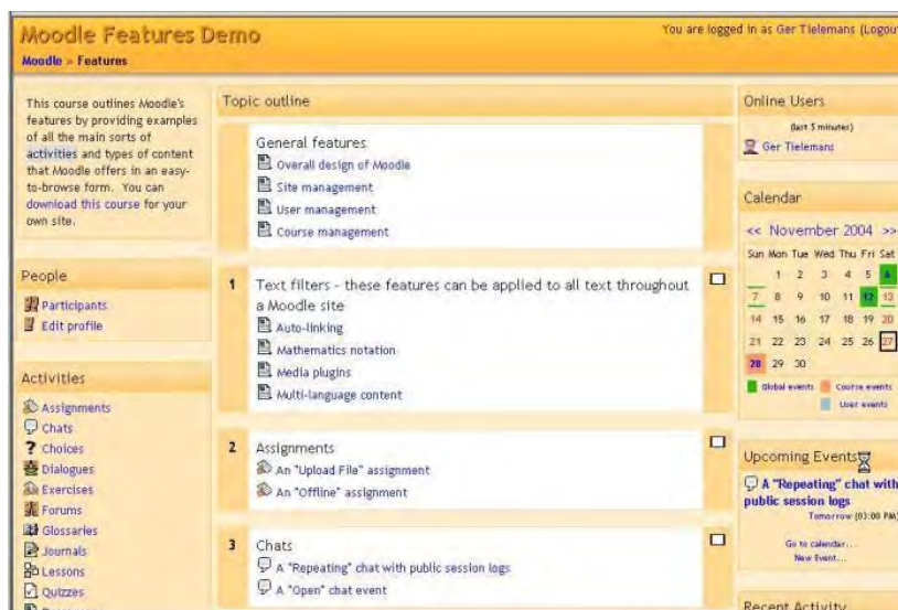
Рисунок 3 – Интерфейс главной страницы LMS Moodle

eFront – система дистанционного обучения и разработки учебного контента с открытым исходным кодом, распространяемая бесплатно.