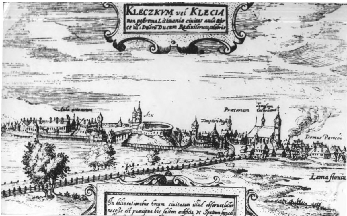
Рис. 3. Панорама Клецка в начале XVII в. Вид с запада (гравюра Т. Маковского)

Пространственную организацию и основы архитектурного решения застройки центра представляет уникальное изображение Клецка начала XVII в., принадлежащее выдающемуся гравюру Т. Маковского, известному благодаря его рисункам Несвижа и Гродно того же времени (рис. 3).