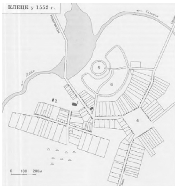
Рис. 1. План Клецка в 1552 г. (реконструкция В. С. Позднякова)

шеевропейским принципам готического регулярного градостроения, а с 1558 г. перешел во владение Радзивиллов, известных своими грандиозными градостроительными мероприятиями. К 1552, 1626 и 1653 гг. относятся письменные исторические документы, перечисляющие городские улицы, состав и характеристику основных сооружений, количество и размеры усадебных участков [1; 2, с. 384-405; 3, с.153-160]. На это время с учетом археологических данных разработаны схематичные реконструкции плана города (рис.1) [4, с. 456; 5, с. 105-108].