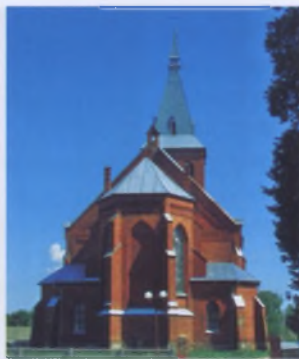
Рис. 16. Костел Благовещения Наисвятейшей Девы Марии в Ольковичах Вилейского района, начало XX в.