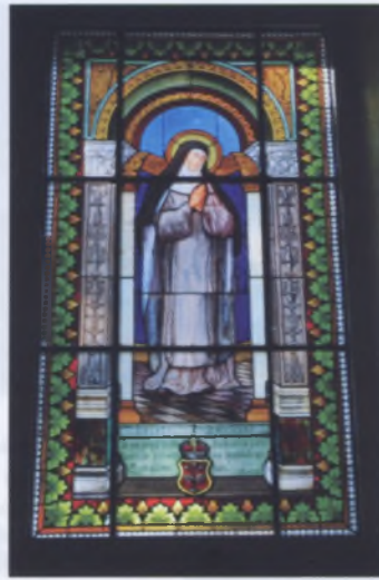
Рис. 10. Витраж в костеле Божией Матери в Шеметово Мядельского района, начало XX века

Порой в деревянных костелах имитировали формы каменного декора — на боковых фасадах окна с полукруглым завершением, пилястры с базами и капителями, карнизы, пояски и т. д. (костел Нахождения Святого Креста в Жирмунах Вороновского района, 1789). А главный фасад костела решен в простых монументальных формах, у входа — лоджия с двумя каменными колоннами. В костеле в Духах Ивьевского района (1772) потолок с помощью кружал воспроизводит свод — форму, присущую каменной архитектуре. В костеле в Волпе Волковысского района заметны элементы классицизма, пришедшего на смену барокко, но и оно присутствует в виде башен и мансардной крыши. Подражание приемам каменного зодчества выражено в декоре стен (карнизы, угловой руст обшивки и т. д.), откровенно проявилось в интерьере. Внутри на стенах воспроизведена средствами живописи кирпичная кладка: расшивка швов с полным подобием цвета (оранжево-розовый «кирпич» и бледно-серые швы «известкового раствора»). Стены расписаны так, чтобы создать у человека иллюзию, будто он находится в каменном здании. Этому содействуют и рисованные под гипс розетки серого цвета — обычный декоративный элемент в каменном зодчестве. А чтобы впечатление было еще более полным, нижняя часть стен высотой 2 м расписана