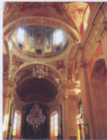
Рис. 5. Роспись середины XVIII века в интерьере костела Божьего Тела в Несвиже