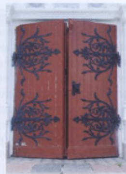
Рис. 17. Дверь костела Сердца Иисуса в Слободке Браславского района, 1903 год