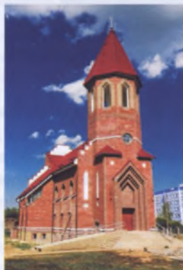
Рис. 19. Троицкий костел в Клецке, начало XXI в.

типичные для XVIII века. Хотя внешние формы близки барочным, в объемно-пространственной структуре прослеживается связь с оборонными четырехбашенными церквями XVI века (Сынковичи Зельвенского, Мураванка Щучинского районов), являющимися оригинальными памятниками белорусской архитектуры.