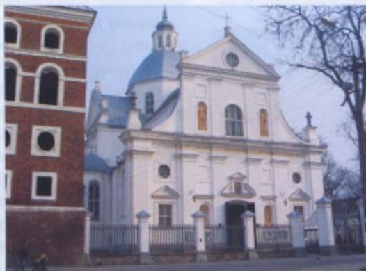
Рис. 2. Костел Божьего Тела в Несвиже, 1593 год