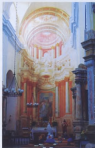
Рис. 6. Роспись в интерьере костела Яна Крестителя в Гольшанах Ошмянского района, XVIII век