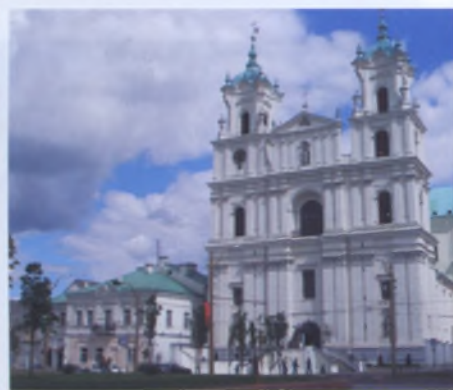
Рис. 3. Собор Святого Франциска Ксаверия (Фарный костел) в Гродно, XVII век