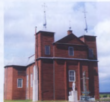
Рис. 13. Костел Яна Крестителя в Волпе Волковысского района, XVII—XVIII века