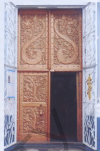
Рис. 7. Дверь костела кармелитов (теперь — церковь Рождества Богородицы) в Глубоком, XVIII век

тектурными деталями (рис. 4–5). Появляются фигурные фронтоны, разорванные карнизы, в интерьерах — богатство резьбы, живописи, росписи стен и сводов, скульптура, сложные столярной работы амвоны, алтари и мебель, ажурнойковки люстры, произведения декоративно-прикладного искусства. Все это воздействовало на эмоции посетителя, стремилось вырвать его из повседневных забот. Способствовали этому и специально создаваемые иллюзорные эффекты, например, создание средствами живописи перспективного сокращения пространства на плоской стене (костел в Гольшанах Ошмянского района, 1618 — рис. 6). Костел кармелитов в Глубоком (1654) получил даже четырехбашенное решение, что сделало его силуэт активным, воспринимаемым с дальних расстояний над гладью озера. В этом костеле сохранился редчайший образец художественной культуры того времени — массивные, укрепленные коваными гвоздями входные двери, украшенные резными изображениями драконов и расте-