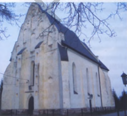
Рис. 1. Троицкий костел в Ишкольди Барановичского района, 1472 год

Постепенно, по мере укрепления позиций барокко происходило развитие и усложнение объемных композиций. На смену плоскому или однобашенному главному фасаду пришли композиции с двумя башнями. Обе башни стали естественными элементами трехнефной структуры здания (разделение внутреннего пространства храма двумя рядами колонн на три части). При этом средний неф обычно делали выше, и через его окна свет попадал внутрь здания, что формировало структуру базилики (рис. 3): костелы францисканцев в Ивенце Воложинского района (1705), иезуитов в Минске (1710) и костел Тадзуша в Лучае Поставского района (1776). Барокко обеспечивало главный фасад и интерьер костела насыщенным раскреповками, пилястрами, карнизами, нишами и другими архи-