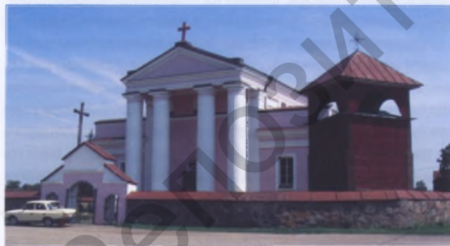
Рис. 8. Костел Святого Станислава в Долгиново Вилейского района, XIX век

Безусловно, были и сооружения без башен — с плоским фасадом. В таком костеле основное внимание уделялось решению именно главному фасаду. Среди архитектурных форм, определявших его, известны изогнутые барочные фронтоны (Каменка Щучинского, 1580; Богданов Воложинского района, 1690), фронтоны из узорчато выложенных досок (Правые Мосты Мостовского района, XVII век). Нередки колоннады на основе элементов, буквально заимствованных из каменного зодчества