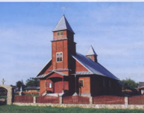
Рис. 18. Костел Девы Марии Королевы в Порплище Докшицкого района, 1937–1941 годы