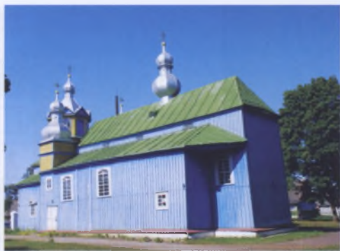
Рис. 15. Михайловская церковь в Степанках Жабинковского района, 1780 год