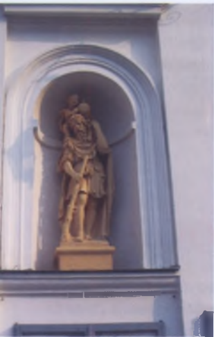
Рис. 4. Скульптура в нише главного фасада костела Божьего Тела в Несвиже