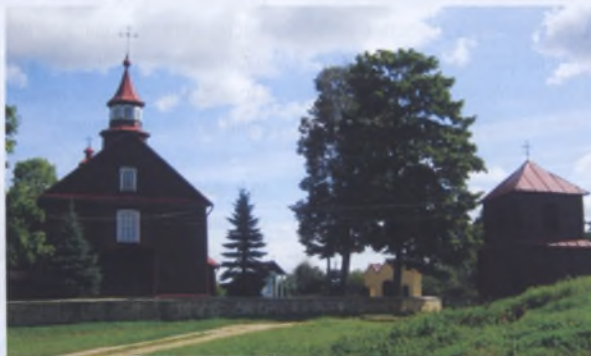
Рис. 12. Юрьевский костел в Новом Дворе Щучинского района, XVIII век

Ярким проявлением местного монументального зодчества в архитектуре костелов, их единением с принципами барокко был костел иезуитов в Слуцке начала XVIII в. (рис. 14). Центричность композиции, предопределенная граненой формой центрального объема, увенчанного высоким куполом, дополнялась четырьмя башнями с четко выраженным ярусным построением. Купол и башни имели развитые шлемовидные завершения,