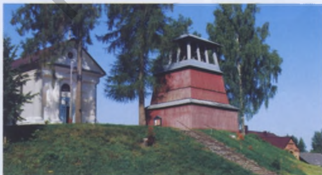
Рис. 9. Костел Божией Матери и колокольня в Шеметово Мядельского района, конец XIX — начало XX веков