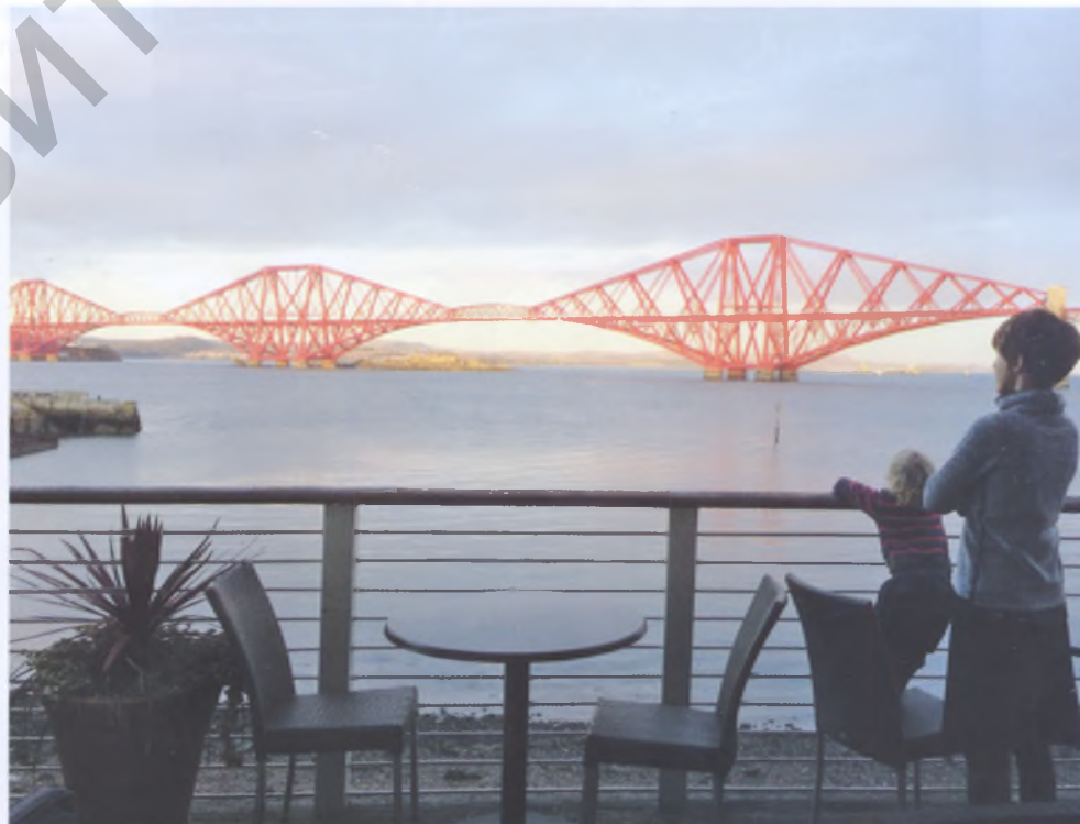
Рис. 3. Цветовые акценты используются в цветовой композиции города для выделения наиболее значимых в композиционном отношении объектов городского пространства. Красный мост в Эдинбурге, Шотландия

Например, для упрощения ориентации в одном из современных безликих московских жилых районов – Марфино использованы цветные символы экзотических животных (носорогов, верблюдов, слонов, жирафов, кенгуру). На основных подъездах и подходах к Марфино размещены крупные упрощенные схемы района с символами животных, выбранных для каждого квартала. Эти символы повторяются