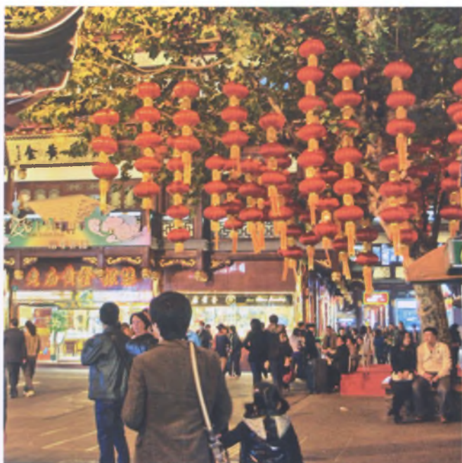
Рис. 7. Яркие праздничные декорации в культурно-туристских зонах «работают» днем и ночью, обновляясь время от времени и обеспечивая эффект новизны. Пекин

решение фасадов жилых домов существенно обогатило их объемно-пространственную композицию (рис. 8).