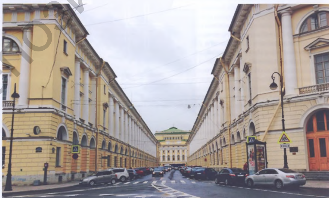
Рис. 1. Даже относительно яркие цвета фасадов зданий в нашей климатической зоне «размываются» эффектом воздушной перспективы в сочетании с пасмурной погодой. Улица К. Росси в Санкт-Петербурге

В современную эпоху цветовой фон каждого конкретного города образуют цвета и оттенки, которым отдают предпочтение его жители и их