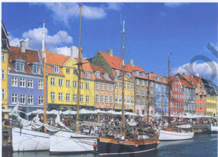
Рис. 5. Новая полихромия исторической застройки