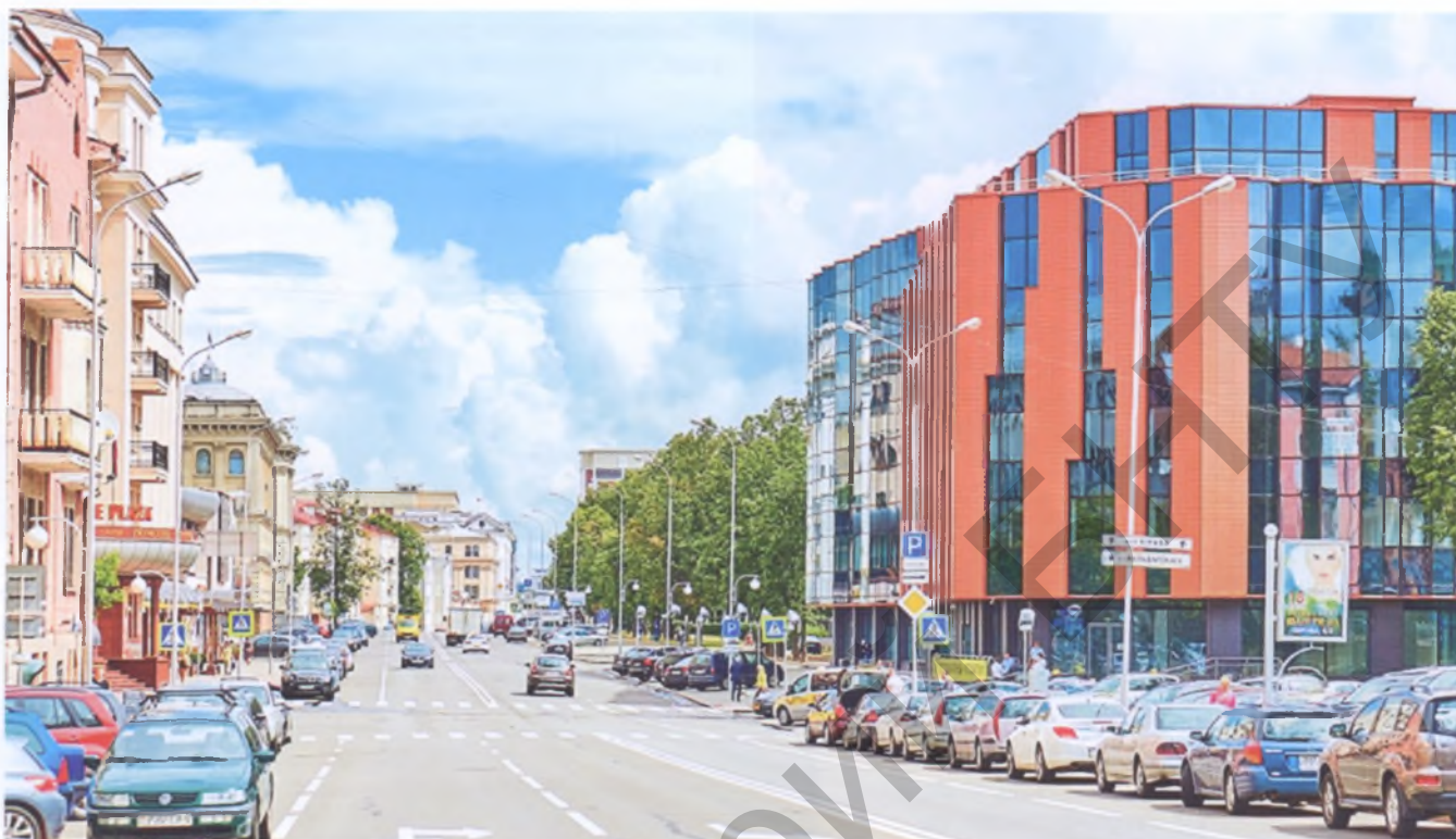
Рис. 9. Офисное здание с торговыми объектами по ул. Кирова в Минске внесло разнообразие в сдержанную цветовую гамму сложившейся застройки этого района города (ЗАО «Белзарубежстрой»)

При формировании художественного образа градостроительного объекта, построении художественной концепции и художественных сюжетов важно установление взаимосвязей между поселением и имевшимися историческими и культурными событиями. Это позволяет обогатить художественный образ поселения, отразить в нем связь времен – прошлого, настоящего и будущего [3].