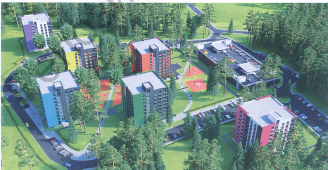
Рис. 8. Чтобы привлечь внимание потенциальных покупателей к объектам недвижимости, все чаще используются яркие цветовые решения новой застройки. Проект нового жилого комплекса в поселке Зацень Минского района (ЗАО «Белзарубежстрой»)

Эстетическое представление о городе обычно иерархично: выделяются объекты общегородского значения (как правило, это крупные общественные здания или природные доминанты с выразительным, запоминающимся обликом) и локальные, по которым создается представление о различных районах города.