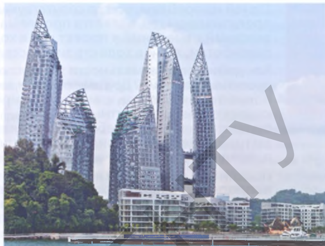
Рис. 12. Оригинальные архитектурные сооружения активно участвуют в формировании художественного образа городов даже без использования ярких цветов. Многофункциональный комплекс Reflections (архит. Даниэль Либекинд). Сингапур

Колористика каждого конкретного города формируется под воздействием цветовой культуры общества, архитек-