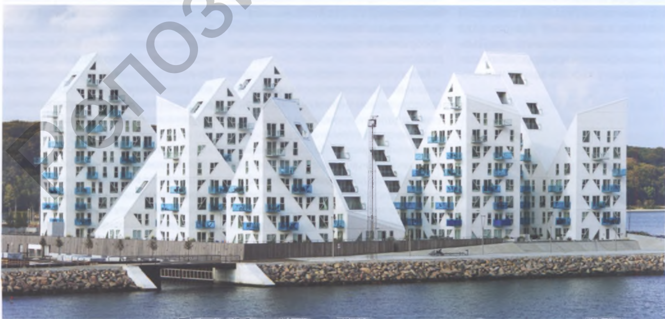
Рис. 11. Жилой комплекс «Айсберг» (4 архитектурные фирмы – Louis Paillard, SEBRA, JDS architects и seARCH) в городе Орхус, Дания, имеет сдержанное цветовое решение – белоснежные стены с полупрозрачными балконными панелями синего цвета