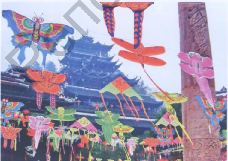
Рис. 6. Яркие краски праздничного оформления культурно-туристской зоны. Нанкин, Китай

на асфальте, на специальных дорожных знаках, на глухих торцах зданий со схемами квартала и номерами домов. Внутри каждого двора также установлен символ большого размера (синий носорог, розовый слон, красный жираф и др.), который хорошо виден из любой точки дворового пространства (рис. 4).