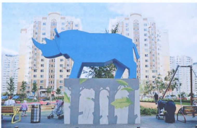
Рис. 4. Синий носорог – символ одного из жилых кварталов Москвы, используемый для упрощения ориентации в жилом районе Марфино