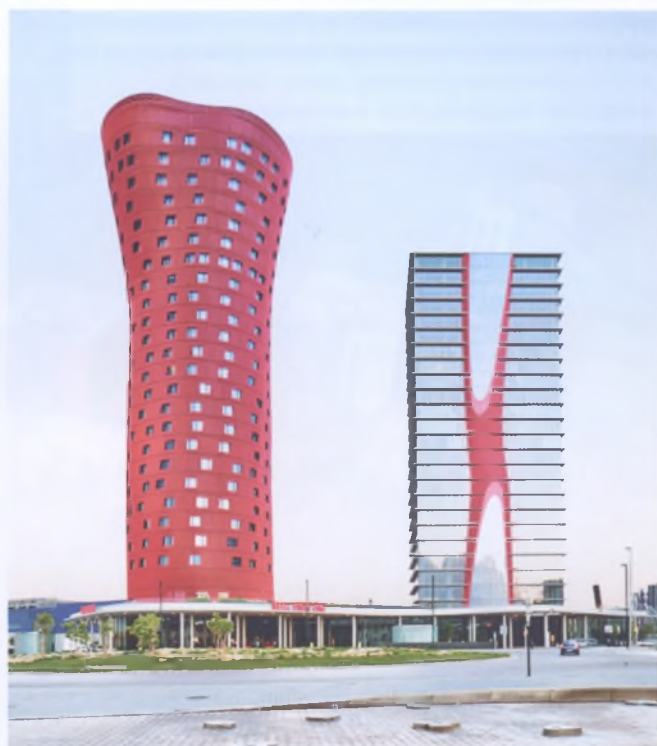
Рис. 10. Пример игнорирования сложившихся закономерностей формирования цветового образа города. Комплекс Torres Porta Fira, включающий отель и офисное здание (совместный проект Тойо Ито и бюро b720 Fermín Vázquez Arquitectos) в промышленном пригороде Барселоны

Многие из нас имеют свой индивидуальный виртуальный город. Активно формируются сетевые мегаполисы . Если бы Facebook был страной, то по численности населения он занимал бы 3-е место в мире после Китая и Индии. Пока люди всецело не переместились в виртуальное пространство, нужно рассматривать виртуальный феномен города в тесной связи с традиционными представлениями о формировании и развитии городов.