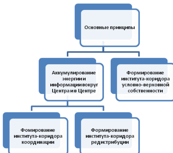
Рисунок 1 – Схема реализации основных принципов в X-экономике

Поскольку все принципы реализуются одновременно, то поэтапность движения в схеме условна. Она необходима, чтобы показать объективность формирования механизма взаимодействия институтов-коридоров в X-экономике и специфическую роль Центра (субъекта – полномочного представителя) в этом механизме. Данная концепция объясняет, почему в X-экономиках (да и в целом в этносоциуме с X-матрицей) субъект, олицетворяющий собой сущность «МЫ», получает столь значимые прерогативы в принятии решений о распоряжении условно-верховой собственностью и организации всей хозяйственной деятельности в социуме. Поэтому в X-экономиках столь неоднозначна роль личности в организации трудовой деятельности. Человек, не получивший полномочий от социума, играет в этой деятельности подчиненную роль, так как формы и направления реализации его потенциальной энергии в действие определяет не он, а Центр. Человек, олицетворяющий начало «МЫ» и получивший такие полномочия, фактически единолично определяет формы и направления трансформации энергии в действие других членов социума. Отсюда – объективная неравнозначность, неравноценность отдельных личностей в X-экономике, признаваемая и одобряемая социумом. Эта неравноценность будет проявляться на всех уровнях социальной организации – от семьи до государства в целом.