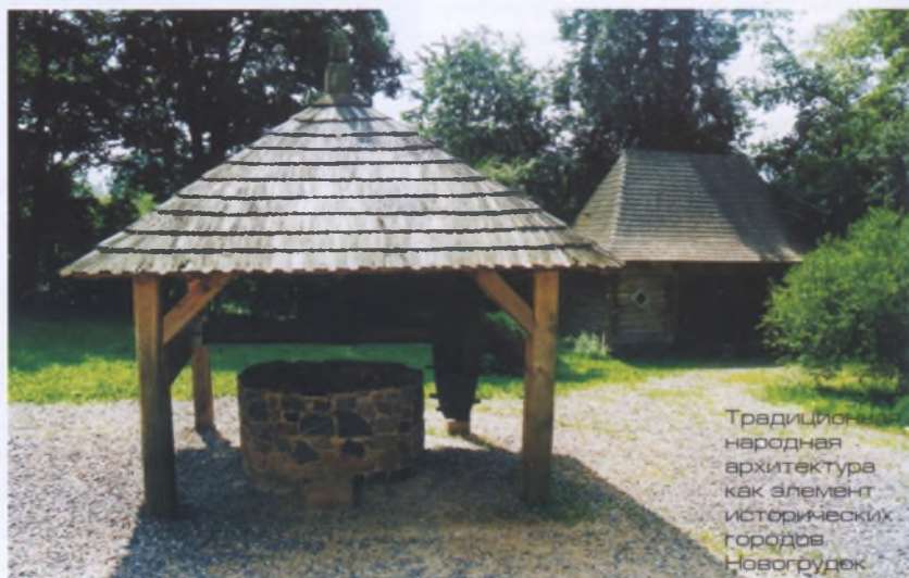
Традиционная народная архитектура как элемент исторических городов Новогрудок

Современное использование исторической застройки. Большая часть исторической застройки малых городов Беларуси нуждается в реконструкции и модернизации с обязательным сохранением особенностей композиционно-пространственных решений. Для нее характерны одноэтажные здания с мансардными или чердачными этажами, торцами выходящие на площади и улицы, с фронтонами треугольной формы, имеющими своеобразный "зубчатый" силуэт. Архитектурно-композиционные особенности застройки исторических городов проявляются также в характерных приемах кладки стен, цоколей зданий, обрамлениях дверных и оконных проемов, цветовой гамме, и они не должны исчезнуть.