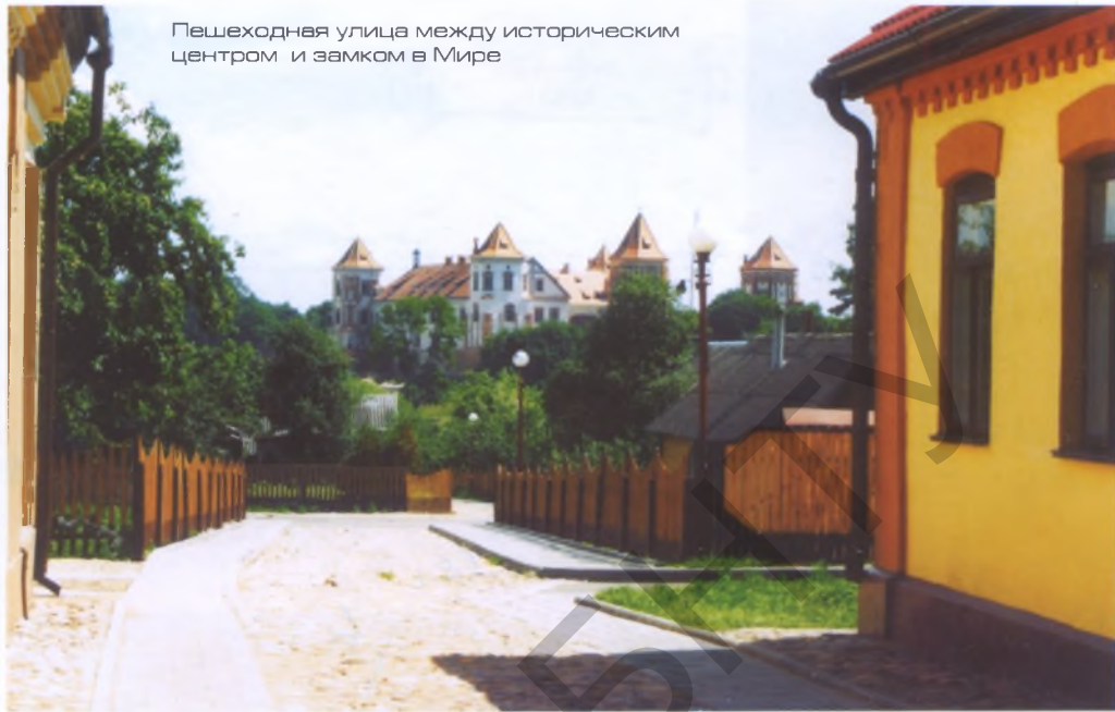
Пешеходная улица между историческим центром и замком в Мире

Создание многофокусных пространственных композиций характерно практически для всех исторических городов. Например, в пространственном решении исторической части Несвижа композиционными центрами являются замок Радзивиллов, городская ратуша, фарный костел, бернардинский монастырь. В зависимости от местоположения наблюдателя и направления обзора они становятся композиционными фокусами новых визуальных картин.