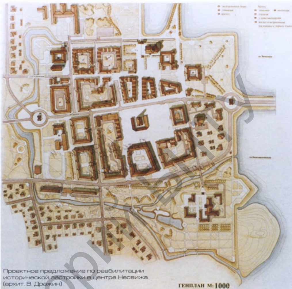
Проектное предложение по реабилитации исторической застройки в центре Несвижа (архит. В. Дражин)

Пространственное разграничение функций обслуживания туристов и проживания местного населения. Увеличение туристских потоков может вызвать необходимость использования внутриквартальных территорий для развития инфраструктуры. Так, на дворовых пространствах, соприкасающихся с туристскими трассами, возможны устройство летних кафе, озелененных мест отдыха для туристов, организация сквозных пешеходных проходов на соседние улицы, создание автостоянок и т.п.