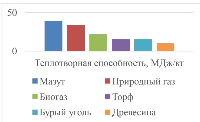
Рисунок 2. Теплотворная способность различных видов топлива

Полученный газ состоит из метана (в среднем 60 %), углекислого газа (38 %), паров воды, незначительного количества сероводорода и аммиака. По составу и энергетическим характеристикам биогаз наиболее схож с природным газом, состоящим на 98 % из метана. Сравнительные данные по теплотворной способности различных видов топлива, используемых в энергетической отрасли Республики, представлены на рисунке 2.