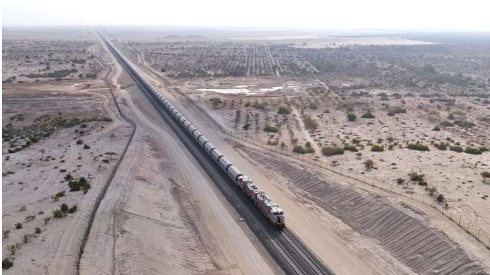
Рисунок 1 - Etihad Rail

Etihad Rail будет первый национальный грузовой и пассажирской сетью железных дорог, соединяющая семь эмиратов Объединенных Арабских Эмиратов (ОАЭ). Проект железной дороги 1200 км оценивается стоимостью 11 млрд $. Ожидается, что он будет обслуживать около 16 миллионов пассажиров и 50 миллионов тонн грузов. Железнодорожная инфраструктура будет в значительной мере способствовать сокращению выбросов химикатов проезжей частью.