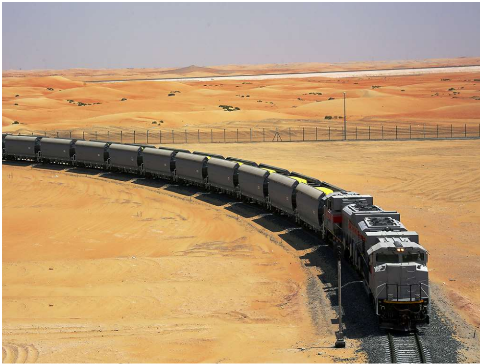
Рисунок 3 – Грузовой локомотив

Сеть будет первоначально работать на дизельном топливе, в то время как электрификация планируется в будущем. Грузовые поезда будут курсировать со скоростью до 120 км / ч, пассажирских поездов в 200 км / ч.