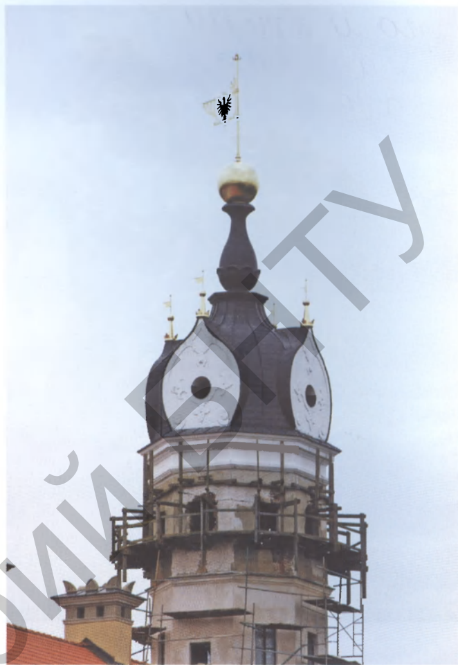
“Архитектурные фантазии” в реставрации: башня Несвижского дворца

То же самое касается Лошицы: главное – сохранить дух старой усадьбы. А это сложное, тонкое дело. Приведу пример. В Несвиже есть очень красивое место. Когда переходишь по насыпи к замку, оборачиваешься и видишь фарный костел на фоне воды – изумительное зрелище. Но как только внизу у озера поставили пивные палатки, все разрушилось, чудо исчезло. Знаю, оппоненты ответят: мы развиваем туристскую инфраструктуру. Так надо было продумать раз-