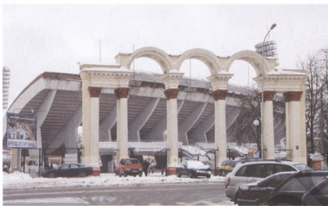
Игнорирование исторического архитектурного контекста: реконструкция стадиона “Динамо” в Минске

Возвращаясь к Мирскому замку... Не будем спорить о нем самом, поскольку он уже есть. Но благоустройство его выполнено, к сожалению, на недостаточно высоком уровне и абсолютно не соответствует понятию исторической среды. Памят-