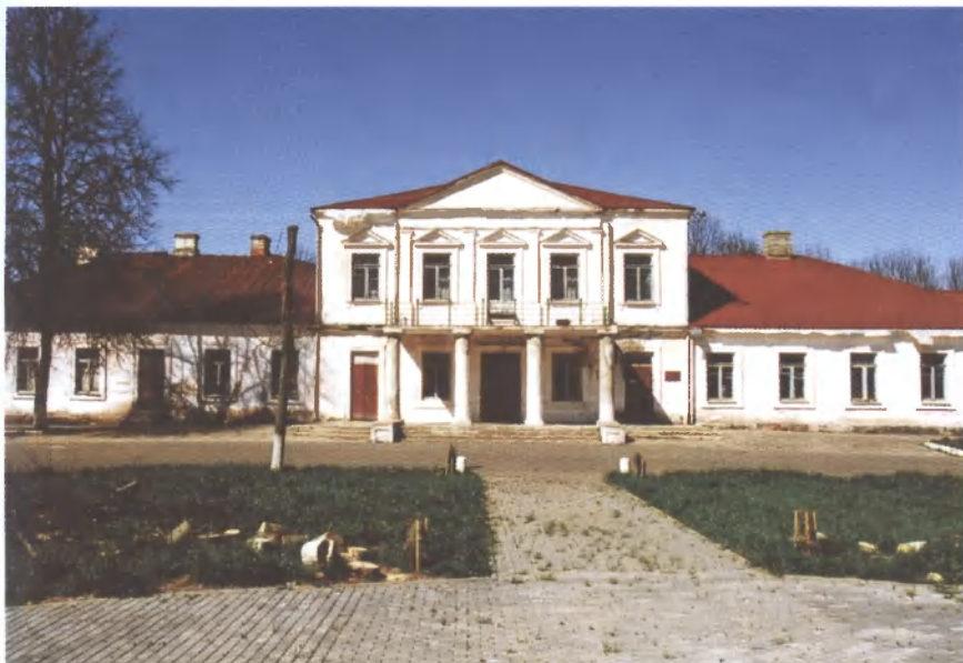
Чуждый памятнику материал: использование металлочерепицы типа "Раннила" на усадебном доме в Городце (Шарковщинский р-н Витебской обл.)

процесс не должен подменяться эрзацами или суррогатами. Примеры тому у нас уже были. Помнится, в советское время расцветали "народные" ансамбли, которые одевались в невероятные пестрые одежды, ничего общего с подлинно народным не имевшие. И когда спрашивали, как у нас развиваются национальные культуры, в доказательство лояльности к национальному развитию предьявляли эти коллективы.