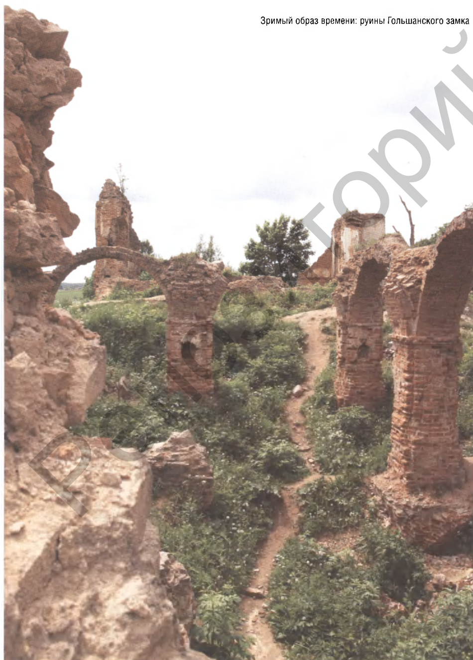
Зримый образ времени: руины Гольшанского замка

– Безусловно, позиция и мнение автора проекта, архитектора очень важны. Способность идти