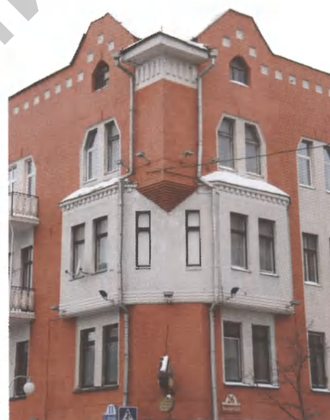
Игнорирование цвета и фактуры материала памятников: покрытие акриловой краской стен дома по ул. К. Маркса, 5 и дома по ул. Володарского, 26 (бывшее здание Либаво-Роменской ж/д) в Минске

Тут мы сталкиваемся еще с одной проблемой. Не все упирается в министерства, департаменты, чиновников. Очень многое зависит от общества и общественного сознания. Сегодня наше общество живет журнальной красотой, изображением в телевизоре – ярким, пестрым, быстро меняющимся. Психология молодежи такова: не думай о старости, care diet – живи сегодняшним днем. И такой настрой преобладает, доминирует в умах. Нам важно научиться воспринимать жизнь как естественный процесс, имеющий разные возрасты, разные лики, научиться осознавать время как имеющее глубину и разные измерения – для того чтобы мы не ощущали себя однодневками, чтобы чувствовали за собой предков, понимали, что нити, протянутые из прошлого в будущее, затрагивают нас и влияют на день сегодняшний. Это один из ключевых моментов национальной самоидентификации, которая, на мой взгляд, еще только начала формироваться. И данный