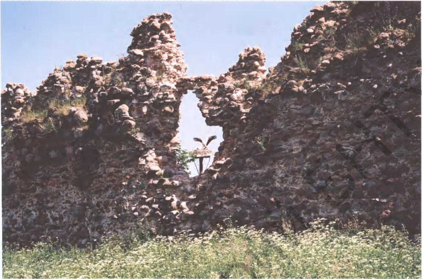
Руины замка в Крево

нальных кадров тогда по сути не было и не существовало четкой, крепкой связи между наукой и теми организациями, которые проводили работы по реставрации. Но реставрация – это кроме всего прочего и значительный строительный процесс. А он тоже стал у нас самоцелью. Как известно, любой строитель, не только реставратор, заинтересован в объемах работ и ставит их во главу угла. Стали лоббироваться интересы строителя за счет потребностей в объемах работ. И все это сопровождалось порой недостаточно высоким уровнем научного руководства. Это еще одна проблема.