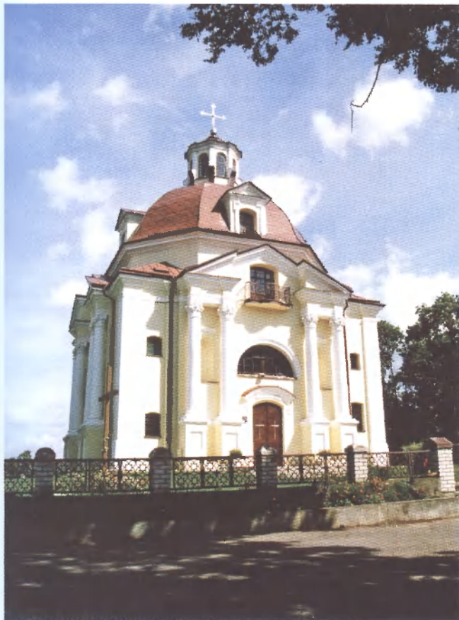
Памятники, сохранившие архитектурный образ после реставрации: Станиславский костел в Мыделе, Каменецкая вежа

на компромиссы заложена в характере человека, но идти на них можно до определенного момента. Если компромиссы приводят к серьезным утратам в эстетике, а в сфере реставрации – к утрате духовной памяти, то им человек должен противостоять. И противопоставлять свои знания. Патриотизм, если хотите. В моем понимании, он проявляется и в отстаивании профессионального мнения. Если мы воспитаем настоящих профессионалов, уверенных в своих действиях, то во многом поможем своей стране. В реставрации это – не лозунги, не громкий пафос.