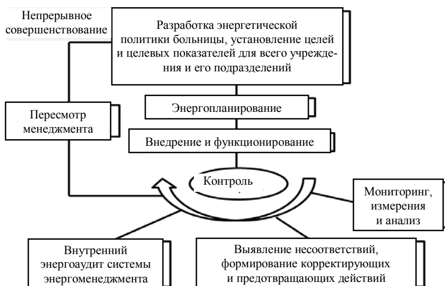
Рис. 1. Концепция модели системы энергетического менеджмента

На рис. 2 показана схема, отображающая совокупность существенных факторов, которые необходимо учитывать при разработке, внедрении и поддержании системы энергетического менеджмента и системы управления электроэнергией больницы. К ограничительным факторам относятся, например, природно-климатические условия, экономическая ситуация и инвестиционный климат, виды первичной энергии и т. п. Среди факторов, на которые можно воздействовать в той или иной степени, – виды потребляемой энергии, энергетические характеристики здания, выбор поставщика электроэнергии и