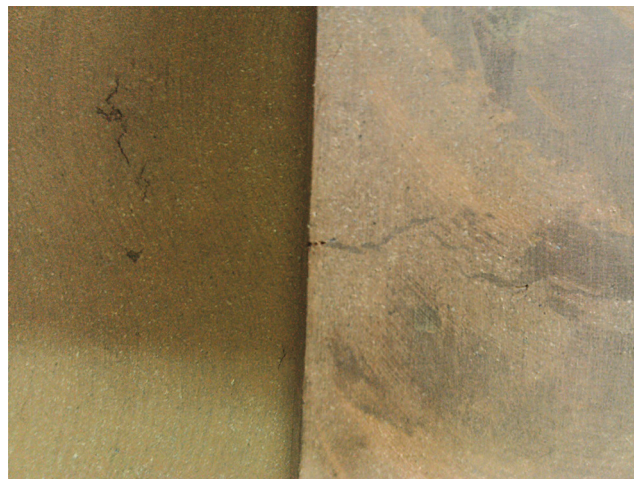
Рис. 2. Внешний вид тормозных накладок из фрикционного материала «BZMK-1» (ИММС НАН Беларуси)

жащих в своем составе значительное количество канцерогенного асбеста [2]. Таким образом, проблема замены фрикционных асбестосодержащих материалов на безасбестовые без потери их эффективности и снижения износостойкости материалов является актуальной и в настоящее время.