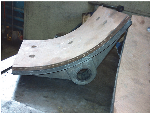
Рис. 3. Тормозные колодки с установленными фрикционными накладками производства ИММС НАН Беларуси

струкции накладок. Были испытаны два комплекта тормозных накладок (размер 180×325×12 мм, радиус кривизны 500 мм). После установки первой пары накладок на металлический каркас на поверхности накладок образовались небольшие поверхностные трещины (рис. 2). Дальнейший опыт эксплуатации показал, что такие дефекты никак не сказываются на работе накладок.