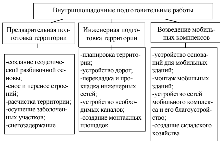
Рисунок 2 – Внутриплощадочные подготовительные работы

Актуальным направлением исследований в этой области является разработка интегральной модели организационно-технологических и управленческих решений, позволяющей выбирать оптимальные критерии создания конечного продукта и последующего мониторинга их выполнения.