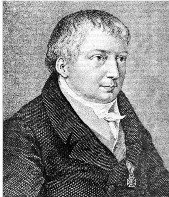
Рис. 9. Фридрих Шлегель [9]

Романтическая идея «эстетической терпимости» сыграла важную роль в возникновении возможности «выбора» архитектурного стиля, формировании «архитектуры выбора». По мнению Фридриха Шлегеля (1772-1829) (рис. 9), «соль эстетики должна составлять широта эстетических вкусов».