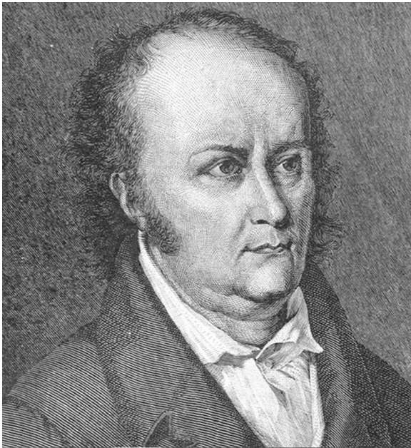
Рис. 8. Жан Поль (Иоганн Пауль Фридрих Рихтер) [9]

список эстетических категорий. Одними из наиболее значимых стали «живописное» и «возвышенное».