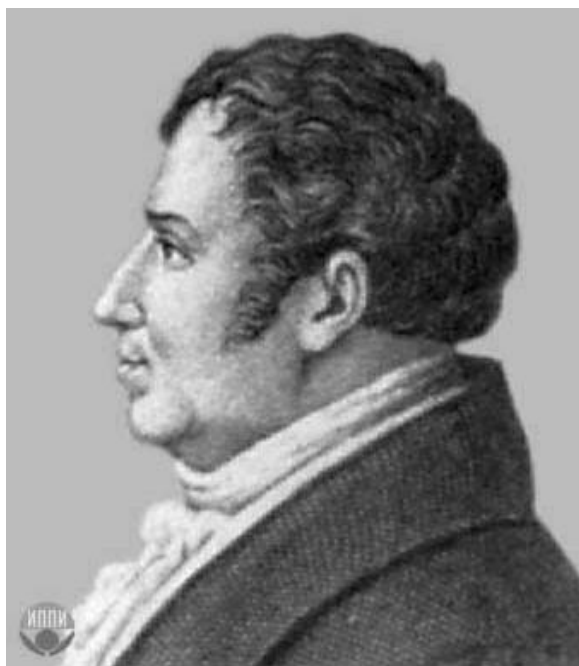
Рис. 7. Август Вильгельм Шлегель [9]

Август Вильгельм Шлегель (1767–1845) (рис. 7) отмечал «исключительные технические совершенства» готических храмов. Он считал, что в своем творчестве архитектор «не выходит за рамки природы, которой, как в ее органическом, так и неорганическом выражениях, присущи строгие законы симметрии...» [7, с.52].