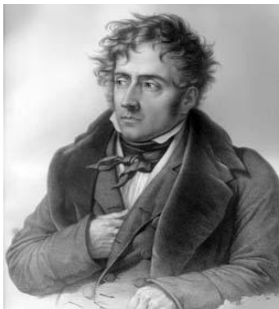
Рис. 2. Франсуа Рене де Шатобриан [9]

Подобную позицию во Франции занимал Ф.Р. де Шатобриан (1768-1848): в готике «все внушает священный трепет и напоминает о Боге» [3, с.190] (рис. 2).