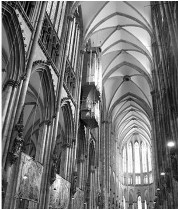
Рис. 6. Интерьер Кёльнского собора

Август Вильгельм Шлегель (1767–1845) (рис. 7) отмечал «исключительные технические совершенства» готических храмов. Он считал, что в своем творчестве архитектор «не выходит за рамки природы, которой, как в ее органическом, так и неорганическом выражениях, присущи строгие законы симметрии...» [7, с.52].