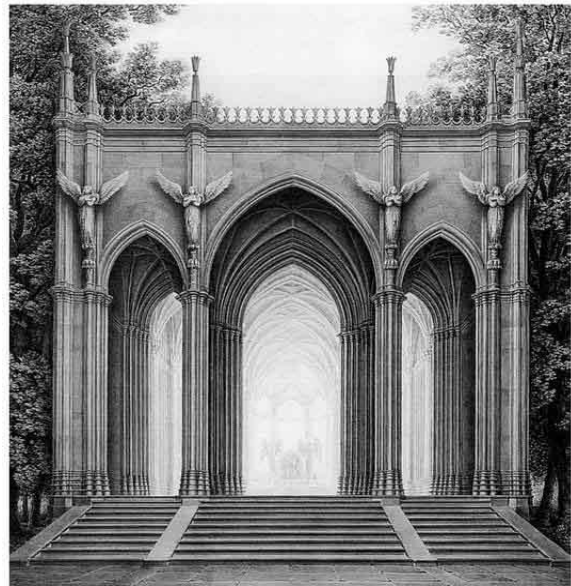
Рис. 5. Карл Фридрих Шинкель. Проект мавзолея королевы Луизы. 1810 [9]

Идеи Тика о «стремлении в небо» были воплощены К.Ф. Шинкелем в проекте мавзолея королевы Луизы (1810) (рис. 5).