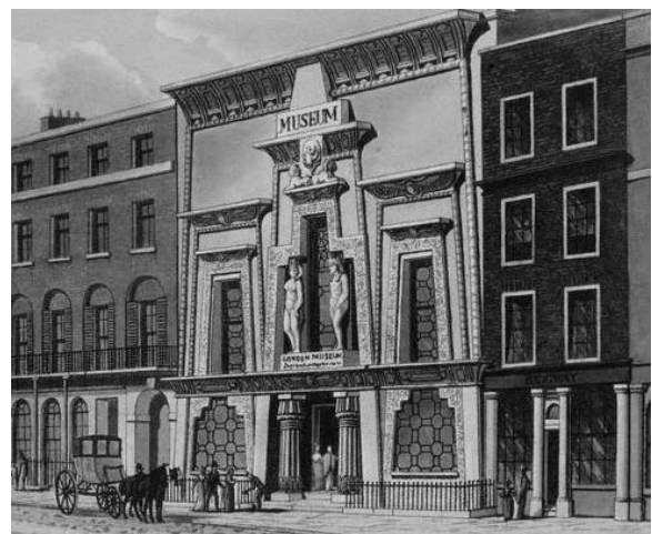
Рис. 10. Лондон «Египетский зал». Архитектор П. Робинсон (1812) [9]

Также он попытался утвердить в эстетике концепцию «характерного».