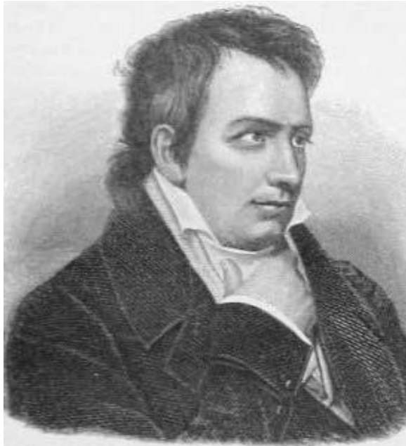
Рис. 3. Людвиг Тик [9]

Тик писал о соборе в Страсбурге: «Эти... повторяющиеся массы выражают нечто возвышенное, даже идеализированное! Это сам дух человека, его разносторонность связана в зримое единство. Это смелое стремление к небу, непостижимому времени и бесконечности» [5, с.30] (рис. 4).