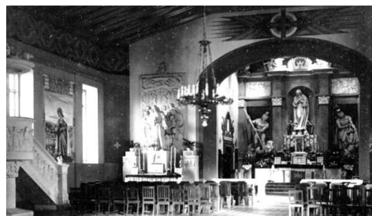
Il. 7. Kościół garnizonowy w Lublinie po przebudowie w latach 1927-1932 (dawna typowa cerkiew wojskowa św. Ikony Matki Bożej Gruzjińskiej). Widok wnętrza w kierunku prezbiterium.