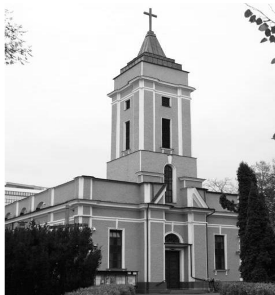
Il. 5. Kościół pw. Niepokalanego Poczęcia NMP w Lublinie (dawna cerkiew wojskowa św. Ikony Matki Bożej Gruzjińskiej). Widok współczesny od frontu.