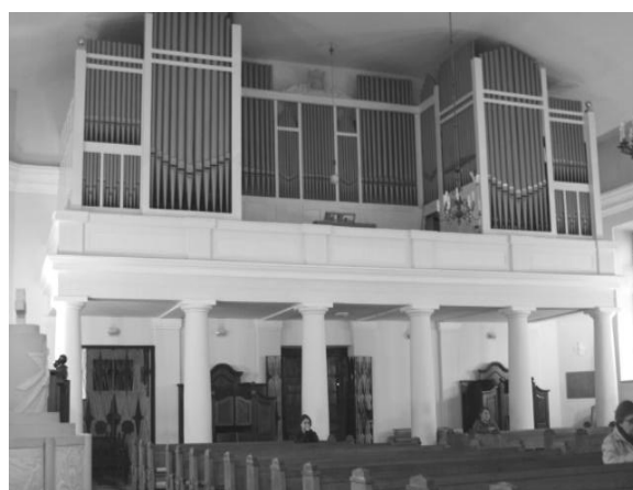
Il. 11. Kościół pw. Niepokalanego Poczęcia NMP w Lublinie (dawna typowa cerkiew wojskowa św. Ikony Matki Bożej Gruzjińskiej). Widok wnętrza świątyni w stronę chóru.