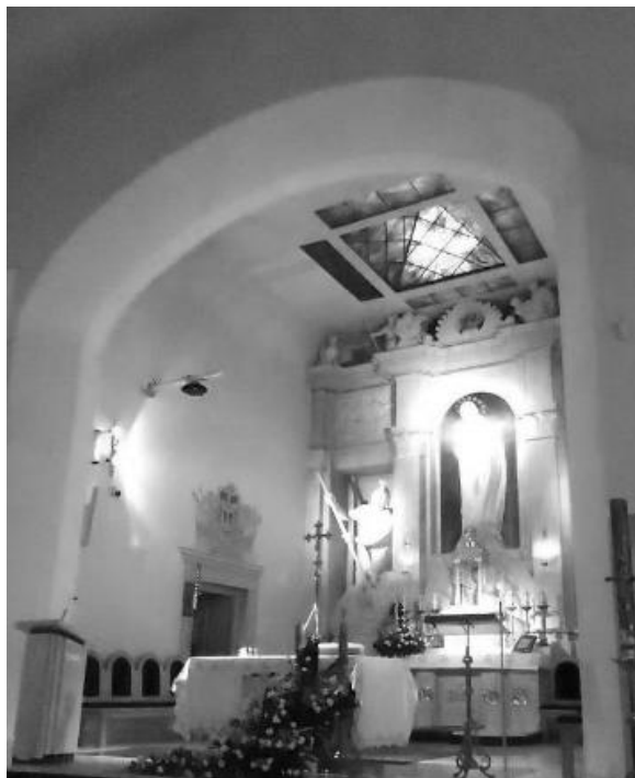
Il. 8. Kościół pw. Niepokalanego Poczęcia NMP w Lublinie (dawna typowa cerkiew wojskowa św. Ikony Matki Bożej Gruzjińskiej). Widok prezbiterium. Fot. A. Januskiewicz, 2014 r.