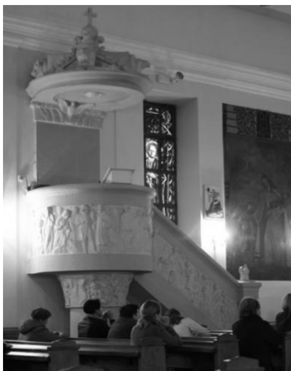
Il. 9. Kościół pw. Niepokalanego Poczęcia NMP w Lublinie (dawna typowa cerkiew wojskowa św. Ikony Matki Bożej Gruzjińskiej). Widok ambony. Fot. A. Januskiewicz, 2014 r.