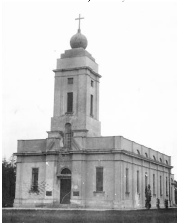
Il. 4. Kościół garnizonowy w Lublinie (dawna cerkiew wojskowa św. Ikony Matki Bożej Gruzjińskiej) po przebudowie w latach 1927-1932