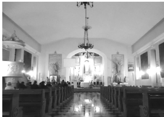
Il. 10. Kościół pw. Niepokalanego Poczęcia NMP w Lublinie (dawna typowa cerkiew wojskowa św. Ikony Matki Bożej Gruzjińskiej). Widok wnętrza świątyni w stronę prezbiterium. Fot. A. Januskiewicz, 2014 r.