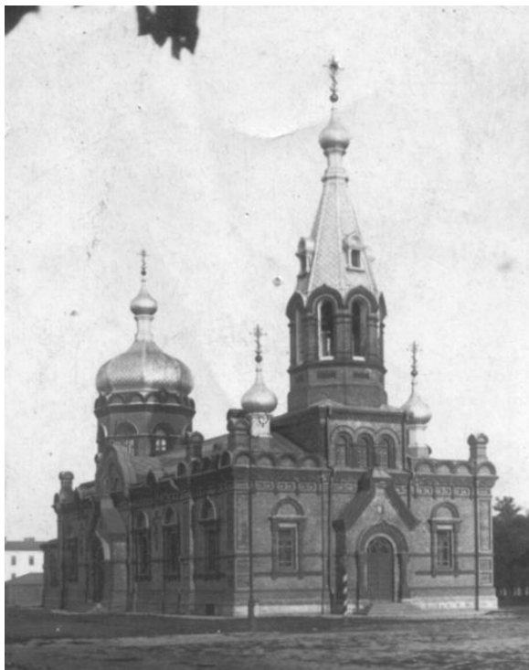
Il. 3. Cerkiew wojskowa św. Ikony Matki Bożej Gruzjińskiej w Lublinie. Widok od strony północnej.