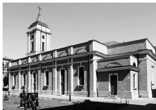
Il. 6. Kościół pw. Niepokalanego Poczęcia NMP w Lublinie (dawna cerkiew wojskowa św. Ikony Matki Bożej Gruzjińskiej). Widok współczesny od strony prezbiterium. Fot. A. Januszkiewicz, 2014 r.