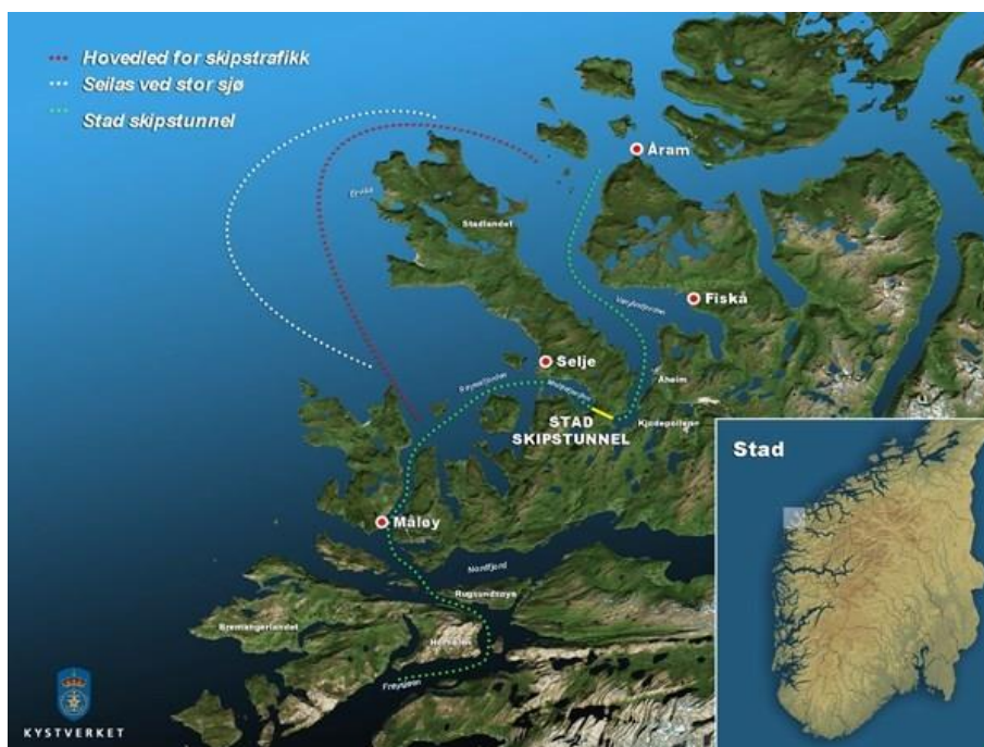
Рисунок 1 – Желтой чертой на карте указан тоннель, а пунктиром обозначены пути, которыми пользуются на данный момент

Один вход в тоннель будет находиться возле норвежского города Селье, а второй близ города Молде (Рис.1).