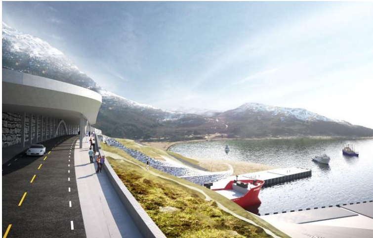
Рисунок 2 – Мост для наблюдения за прохождением судами тоннеля

У одного из входов в тоннель будет построен мост, на котором туристы и все желающие смогут посмотреть на прохождение судов в тоннеле (Рис. 2).