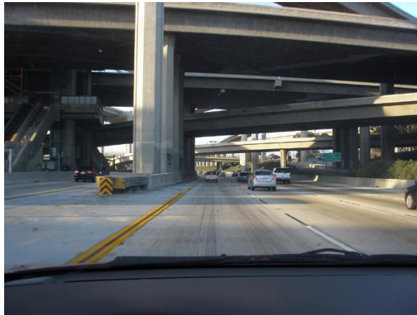
Малюнак 2 – Транспорт, які заезджае на развязку

могуць трапіць на магістралі для пасажырскага транспарту I-110. Аўтамабілісты, якія ўязджаюць з паўднёвага боку на магістралі для пасажырскага транспарту I-110, не маюць прамога доступу на магістралі I-105, і могуць проста рухацца далей у паўночным кірунку. Вадзіцелі пасажырскага транспарту, якія хочуць трапіць на пэўны шашы, да якога не прадугледжана праяма злучальная магістраль, павінны выехаць з паласы руху для пасажырскага транспарту ў пэўным месцы ўезду/выезду перад развязкай і перамясціцца на галоўную злучальную магістраль, як звычайна робяць на ўсіх пасажырскіх палосах руху ў паўднёвай Каліфорніі. (Мал. 2)