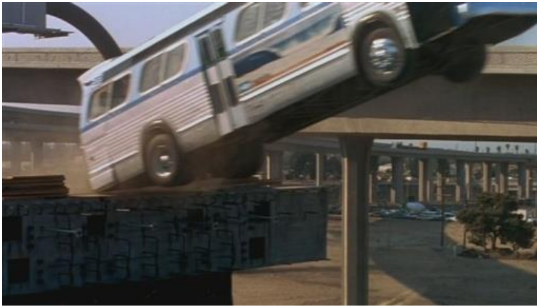
Малюнак 3 – здымкі фільма "хуткасць"

У 1996 годзе, Федэральная дарожная адміністрацыя ЗША прысудзіла федэральнай аўтастрадзе 105/ 110 ўзнагароду, як «цуд інжынернай думкі» за выдатнае праектаванне дарогі. Тым самым урад прызнала, што праект рэалізаваны цудоўна: колькасць коркаў на дарозе зменшылася, рух стаў больш бяспечным, а паветра чысцей. (Мал. 4)