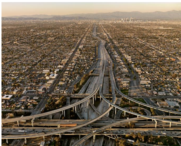
Малюнак 1 – Развязка імя суддзі Гары Преджерсона

Яе адкрылі ў 1993 годзе. Развязка была названая ў гонар суддзі Гары Преджерсона. Ён доўга займаў пасаду федэральнага суддзі і старшыняваў у судовым працэсе па справе будаўніцтва аўтамагістралі I-105. Гэтая развязка лічыцца адной з самых складаных у свеце (Мал. 1)