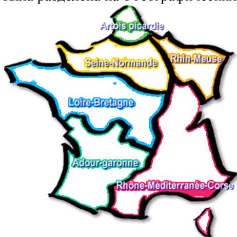
Рисунок 1. – Карта географических зон Франции [1]

Для осуществления эффективного управления водными ресурсами и борьбы с их загрязнением к середине 1964 года вся территория Франции была разделена на 6 географических зон рисунок 1.